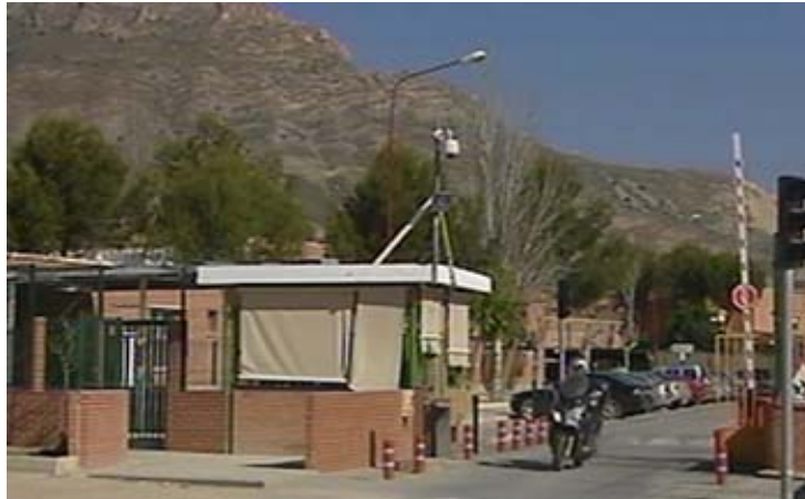
Psiquiátrico penitenciario de Foncalent