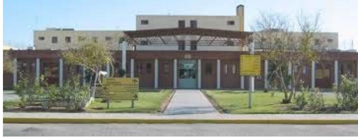
Psiquiátrico penitenciario de Sevilla