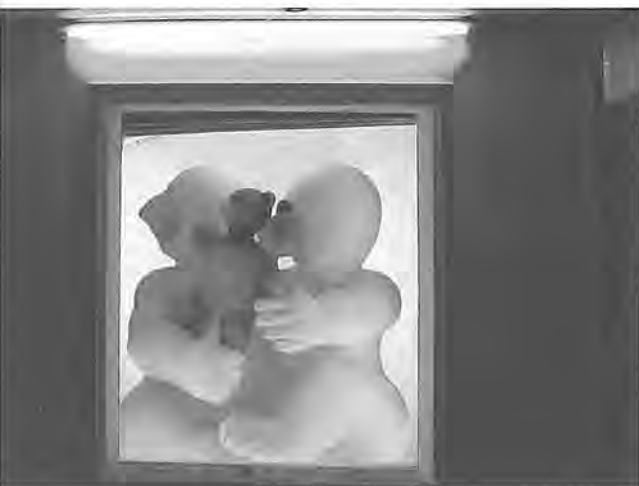
Scarpia (actuación en un Kiosko).

Es un encuentro trianual centrado en la creación de experiencias inmersivas. La inmersión sensorial, especialmente física e inmediata, interdisciplinar, multisensorial y sinestésica son los ejes en los que se mueve este proyecto de arte sonoro. El equipo comisarial (instalado actualmente en La Haya, Holanda) trabaja desde una perspectiva europea y mundial en la documentación de experiencias de este tipo, que son finalmente expuestas tanto en Córdoba como en Lucena.