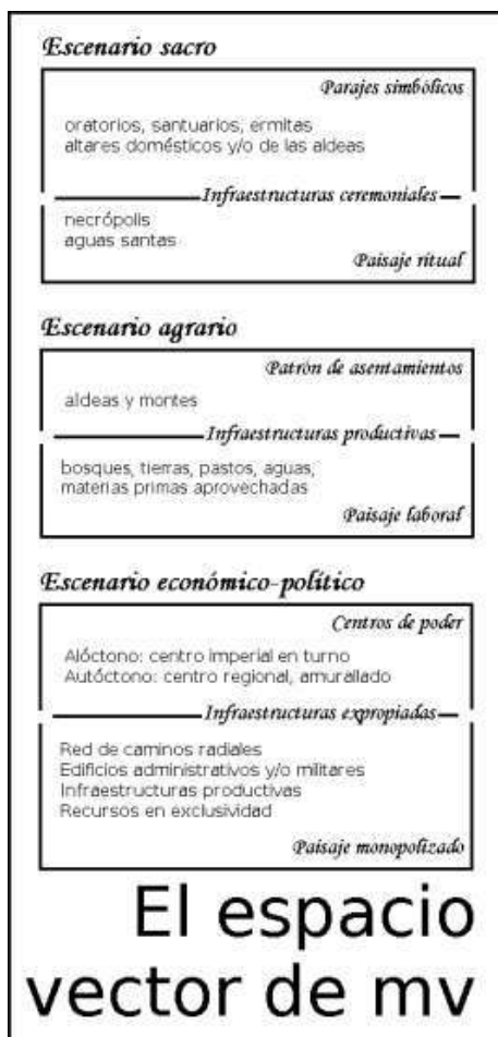
Figura 6. Cuadro esquemático del espacio como vector del modo de vida rural medieval donde están indicadas las principales infraestructuras (de cultura material) que son evidencia de cada escenario