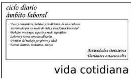
Figura 1. Cuadro esquemático de la vida cotidiana de una comunidad agraria, inherente al ciclo diario de actividades

itacate 15 de los que van al campo. Con esto hago explícito que la vida cotidiana se desarrolla en el contexto del ciclo estacional-anual.