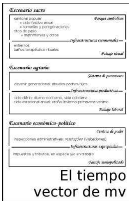
Figura 7. Cuadro esquemático del tiempo como vector del modo de vida rural medieval donde están indicadas los referentes diacrónicos principales (de cultura inmaterial) que son evidencia de cada escenario

El ciclo estacional-anual está encauzado a lograr excedentes de producción que cubran las prioridades alimentarias del futuro mediato; y la vida cotidiana está subordinada e integrada a éste. En ambos, la organización laboral del tiempo es cíclica, por lo que sus correlatos materiales contienen información diacrónica, que es factible deducir. Por ejemplo, la propuesta metodológica basada en el análisis del patrón de crecimiento de bivalvos para la inferencia de la temporada de recolección de moluscos así como del promedio de días dedicados a ello entre las comunidades de cazadoras-recolectoras de la Baja California (Mora 1982). Por su parte, el devenir generacional comprende un tiempo transgeneracional, que no ha estudiado la arqueología.