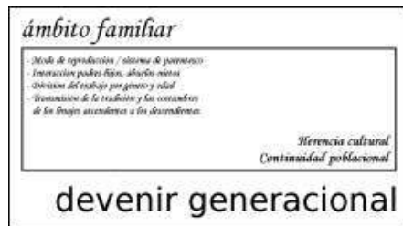
Figura 4. Cuadro esquemático del devenir generacional de una comunidad agraria tocante a la herencia cultural y a la continuidad generacional

sión cultural en los ciclos de vida y en los ritos de paso.