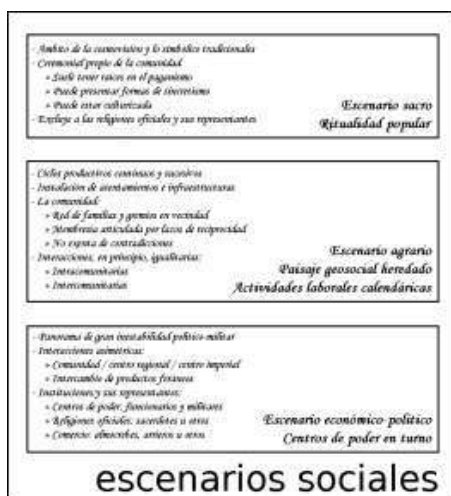
Figura 5. Cuadro esquemático de los escenarios sociales confrontados en el paisaje rural

heredado de la comunidad. Asentada en esta comarca, la comunidad está constituida, en esencia, por la red de familias y gremios en vecindad, que establecen una membresía articulada por lazos de filiación y laborales, de reciprocidad inmediata, mediata, diferida y condicional, no exenta de contradicciones de todo tipo. Las interacciones son, en alguna medida por determinar, igualitarias y se realizan principalmente entre los miembros de la comunidad (interacciones intracomunitarias), aunque también se pueden llevar a cabo interacciones con otras comunidades (interacciones intercomunitarias).