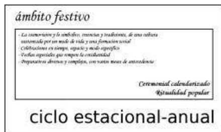
Figura 3. Cuadro esquemático del ciclo estacional-anual de una comunidad agraria tocante a las actividades ceremoniales calendarizadas

Tradicionalmente son actividades iterativas realizadas de año en año o, para algunas faenas, mediando períodos de varios años, como el descortezamiento del alcornoque ( Quercus suber ; “sobreiro”, en portugués), en Marruecos y en la península ibérica, que se realiza de 9 a 14 años, para lo que hay que esperar de 30 a 50 años para obtener la primera corteza de corcho; o como la recolección del piñón ( Pinus cembroides y P. monophylla ) entre la comunidad K'myai de Baja California, Méx., y de California, EU, realizada cada 2 años (arql. Jorge Serrano González, comunicación personal, Mexicali, Baja California, 1989); o, como el cultivo del maguey pulquero ( Agave salmiana y A. atrovirens ) entre los pueblos nahua y otomí del altiplano central de México, cuyo su periodo de aprovechamiento intensivo empieza cuando esta suculenta alcanza la madurez, lo que tarda de 8 a 10 años. Esto ocasiona que sean de ciclo anual. Conjuntamente, también son actividades realizadas en el transcurso de las estaciones y de acuerdo con los ritmos de la naturaleza. Esto origina que sean de ciclo estacional. Por eso propongo, en una síntesis fundamental que retoma estas dos características esenciales, el concepto de ciclo estacional-anual (Figura 2). Además, siempre se debe tener presente que dependiendo de la labor, estas actividades requieren diferentes