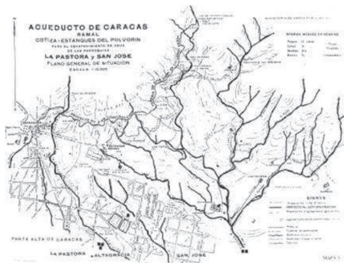
Figura 2. Ubicación del Cuartel San Carlos en el piedemonte del Waraira Repano, sobre la cuenca hidrográfica que alimentaba de agua a la ciudad (Caracas, 1916)

dad de proteger sus rutas comerciales. Simultáneamente, se formó una milicia regular de pardos así como también una tropa veterana profesional, asentada en cuarteles urbanos como el San Carlos en Caracas, cuya principal función era proteger el orden político colonial interno del cual dependía, a su vez, el estatus del imperio español como potencia capitalista europea occidental. Ya desde 1630 se había comenzado a construir una red de reductos defensivos en diversos sitios de la Caracas de entonces, para prevenir cualquier invasión de fuerzas extranjeras o rebeliones populares internas (Liendo 2001: 35). Uno de ellos, quizás el de mayor importancia, fue el Reducto San Pablo, localizado en la terraza baja del río Guaire. el cual estaba integrado por un cuartel y una batería de artillería, un hospital y una iglesia o capellanía (Vargas et al. 1998a). La localización del cuartel San Carlos en el piedemonte del Waraira Repano (Figura 2), permitía sostener el poder hegemónico de la burguesía mantuana, mediante el control de la cuenca fluvial que suministraba el agua a la población de Caracas hasta finales del siglo XIX (Sanoja y Vargas-Arenas 2002).