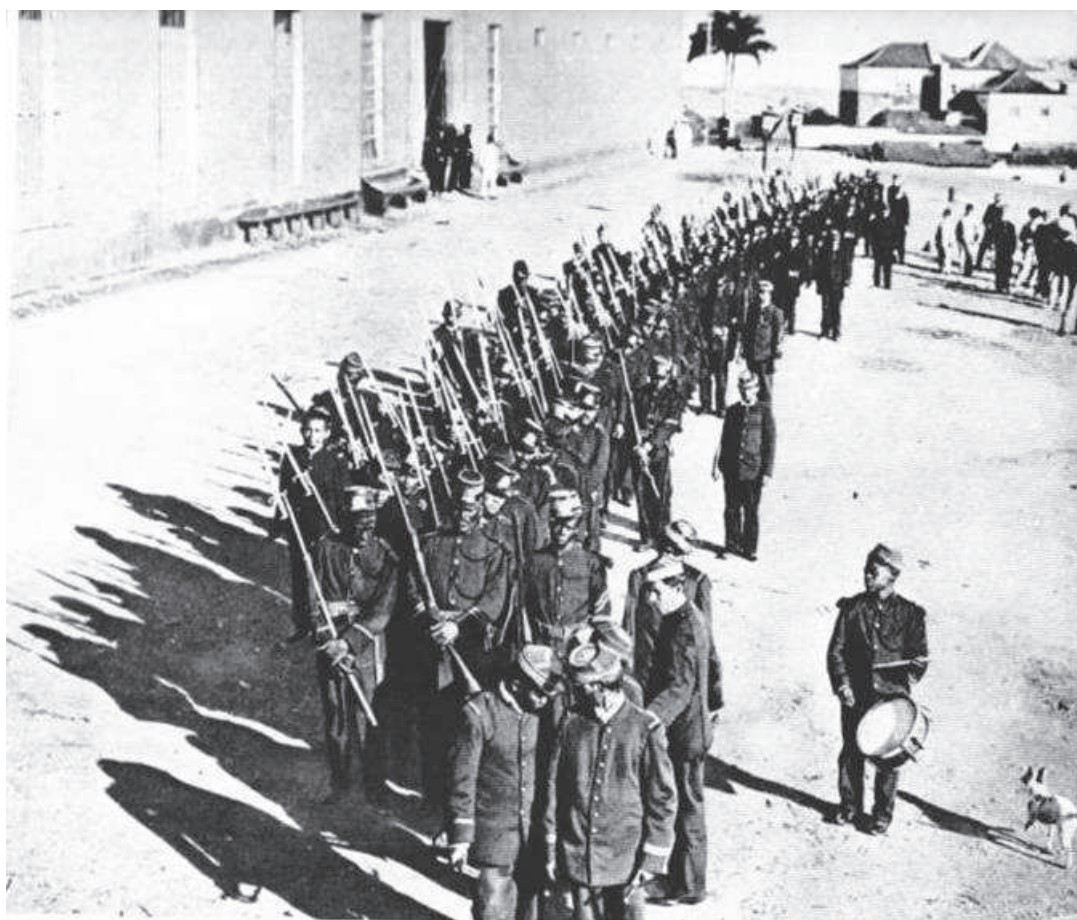
Figura 4. Soldados en formación frente al cuartel. 1902

alimentación y la adquisición de bienes de uso personal eran no sólo producto de la disciplina militar, sino del estilo de vida castrense de un ejército que todavía a finales del siglo XIX no contaba con una organización profesional.