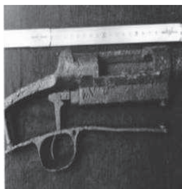
Figura 5. Recámara de un fusil de repetición

El aprendizaje del manejo de las armas y de las tácticas vernáculas de la guerra de guerrillas había sido, sobre todo para los campesinos venezolanos del siglo XIX, como parte de una suerte de ceremonia de iniciación en la vida adulta. Pasar del "chopo 'e piedra" o mosquete de pedernal a los rifles de avancarga y a los fusiles con cartucho metálico, norteamericanos (Winchester) o alemanes (Mauser modelo 70) de finales del siglo XIX (Figura 5), de las tácticas de combate basadas en el concepto del enfrentamiento personal utilizando armas blancas, de la táctica de "un tiro y al machete" a la del combate en formaciones tácticas, no fue aparentemente muy difícil para los campesinos formados habitualmente en una tradición guerrera como montoneros o milicianos. Sin embargo, la vida de cuartel - como parece indicar el registro arqueológico- no hizo sino reforzar la situación de pobreza personal de los soldados de tropa.