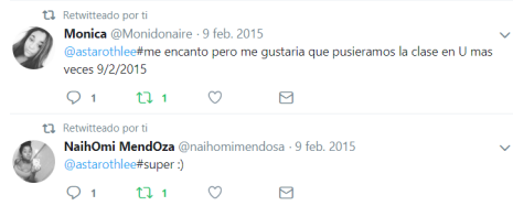
Fotografía 4. ¡Creamos un hashtag!

A finalizar esta experiencia, quisimos saber qué opinaban los estudiantes sobre estas actividades y dinámicas desarrolladas en el aula. Para ello, se les propuso que escribiesen palabras o ideas tanto positivas como negativas que les había sugerido.