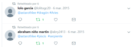
Fotografía 2. ¡Mi horóscopo!