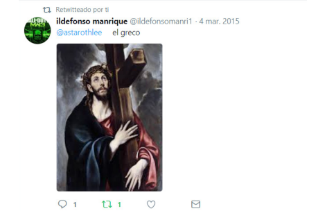
Fotografía 3. ¡Vamos a buscar al pintor!