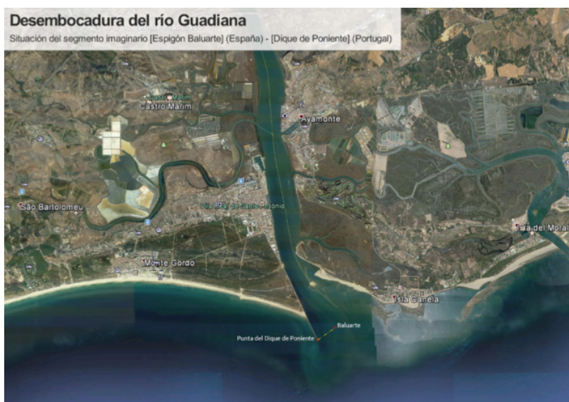
Figura 2: Línea de cierre de la desembocadura del río Guadiana