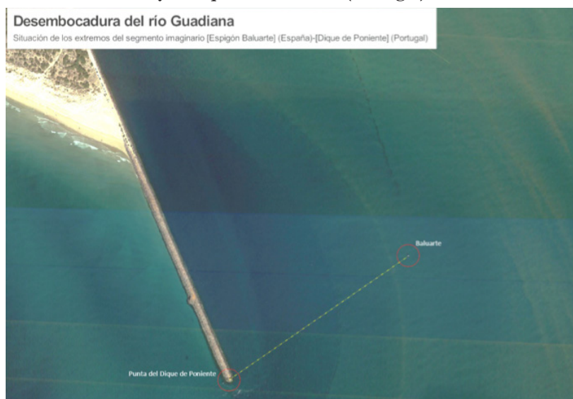
Figura 1: Situación de espigón Baluarte (España) y el dique del Poniente (Portugal)