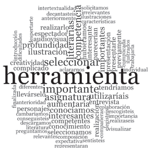
Figura 4. Nube de palabras. Book-trailer como herramienta

Centrados en el análisis previo y en el presupuesto de partida que se poseía en este estudio, se puede concluir afirmando que el book-trailer se convierte en una herramienta que facilita la promoción lectora de las obras literarias infantiles y juveniles – figura 4–, generando así el desarrollo de la competencia literaria en los alumnos (Tabernero, 2015).