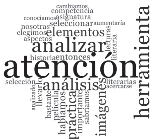
Figura 5. Nube de palabra. Análisis previo de la obra

complejidad de la realización de la herramienta digital y la necesidad de llevar a cabo un buen análisis del libro de manera previa.