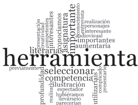
Figura 1. El book-trailer como herramienta

Esto se puede comprobar en la nube de palabras –figura 1–, pues el término herramienta ocupa la posición central de esta: