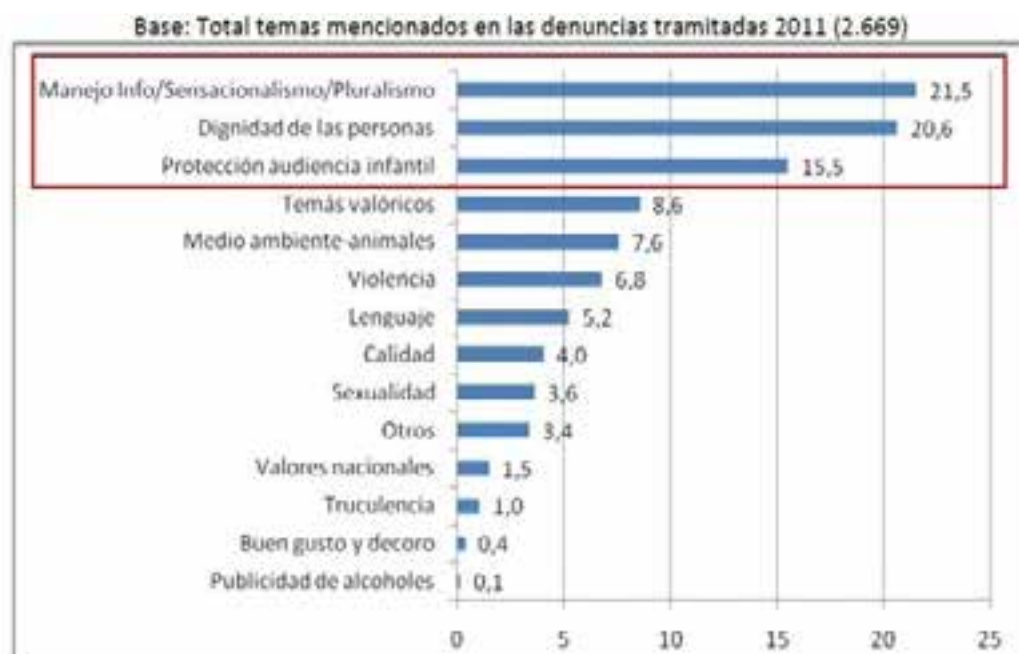
Gráfico 2: Temas denunciados en 2011

12. El programa más denunciado en 2011 es Año Cero de canal 13 con 253 denuncias, que pertenece al género de la telerrealidad.