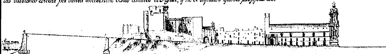
Alzado del Castillo de la Villa, según el Plano de la Muralla de Vendaval de Cádiz, levantado en 1769 por Antonio Gaver.

Perfil que pasa por la Línea M. N, tomado por medio de la Calle de S. Juan de Dios, manifestando que el Castillo de las Guardias Marinas está fundado en Peña viva, y nunca el mar puede rayar por esta parte, ni cubra de todo el frente, que demuestra la exacta Opinión del bulgo; añadiéndose que muchos tiempos estuvo este castillo inundado, y en las mayores Derrumbas no se experimentó Erriago, ó inundacion alguna, por que las admiradas en las Centurias pasadas, y en el Terremoto de Año de 1755, fueron causadas por unas particularidades Enmorcencias del Mar, en cuantas ocasiones elevaba por algun accidental sus límites el Agua, y no de aquellos que los profeta Dios.