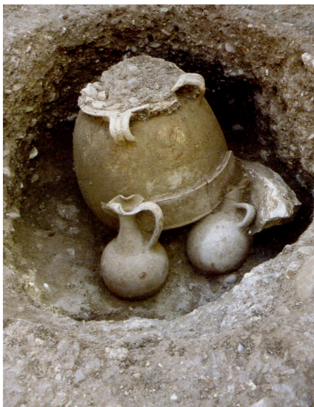
Figura 4. Tumba de fines del siglo IX a. C. de Cortijo de San Isidro (Fuente: Sánchez-Sánchez Moreno et alii, 2011).

También cabe citar dos enterramientos procedentes de Chorreras (Vélez-Málaga), situada en el mismo término municipal que la anterior. La tumba 1 consiste en un hoyo o pozo excavado en la roca (Figura 6), el cual contenía un ánfora de la que hablaremos más adelante, y que hacía las veces de urna cineraria puesto que albergaba los restos incinerados de una mujer que vivió entre 17