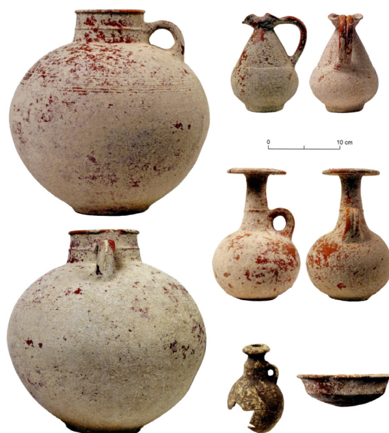
Figura 1. Tumba nº 2 de la necrópolis de Ayamonte (Fuente: García Teysarnder y Marzoli, 2010).

Por otro lado, la ciudad de Cádiz ha venido facilitando algunos materiales descontextualizados que proporcionan una cronología elevada aunque todavía discutida en algunos casos, como acontece con un anillo, un jarro protoático, varios vasos de alabastro que habrían sido reutilizados durante la época romana (Muñoz Vicente, 2002: 25-27) y una píxide descubierta junto a fragmentos de jarros de boca de seta y recipientes pintados con motivos geométricos, por lo que se le ha asignado una cronología en torno a finales del siglo IX o el VIII a. C. (García Alfonso, 2010: 1324-1332; Torres Ortiz, 2010: 45). Sin embargo, recientemente se ha dado a conocer una sepultura conteniendo una incineración en fosa rectangular con las esquinas redondeadas excavada en la arcilla dispuesta sobre la roca base, la cual queda delimitada por