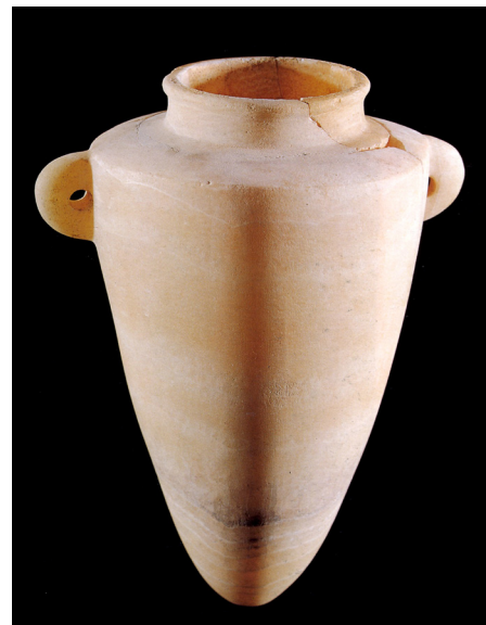
Figura 7. Vaso de alabastro de Lagos que fue usado como urna cineraria.