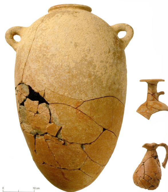
Figura 3. Materiales de la segunda incineración de la tumba 5 de Ayamonte

algunas piedras con una cubierta también hecha con una capa de arcilla, y que ha sido datada en la segunda mitad del siglo VIII a. C. En su interior se hallaron, junto a los restos humanos incinerados, otros de carbones y de fauna integrada por especies como vacas, cabras, ovejas y conejos, además de recipientes cerámicos decorados con engobe