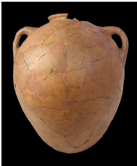
Figura 6. Ánfora usada como urna de Chorreras.