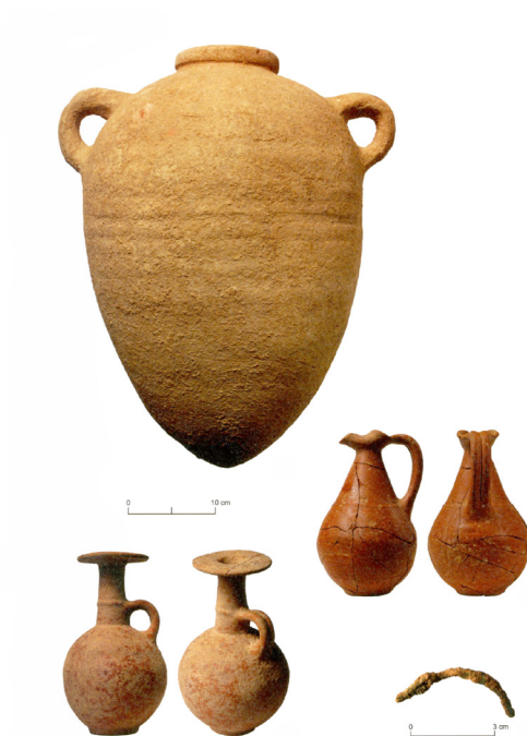
Figura 2. Materiales de una de las incineraciones de la tumba 5 de Ayamonte Fuente: García Teysarnder y Marzoli, 2010).