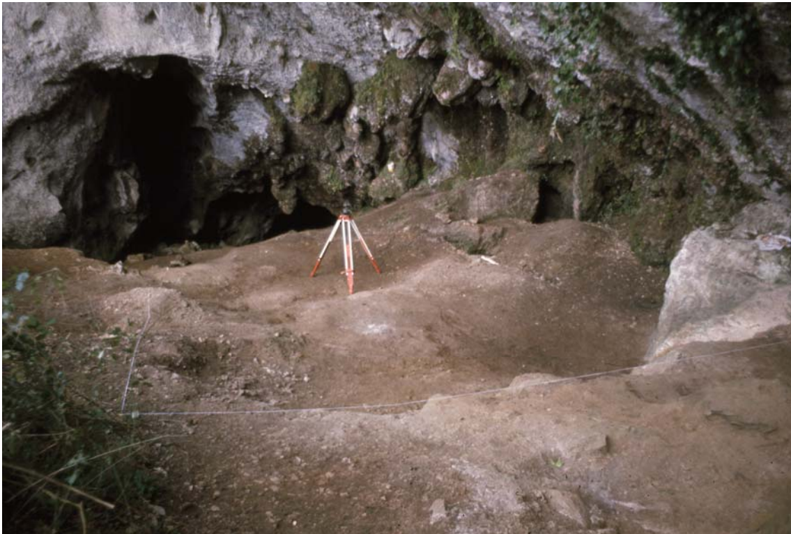
Figura 2. El conchero asturiense de la cueva de Mazaculos II

recogerá otras citas de Asturiense en Cataluña y Galicia, algo que será revisado posteriormente por otros autores (Clark, 1976; González Morales, 1982). Obermaier establece la secuencia cronológica del Paleolítico y el Mesolítico en el Cantábrico siguiendo las líneas de la aceptada cronología francesa (Straus y Clark, 1978:293). Sin embargo, a pesar de excavar en múltiples yacimientos con evidencias de explotación del medio marino, no se dedica a estudiar la explotación del litoral en detalle, como hizo Vega del Sella.