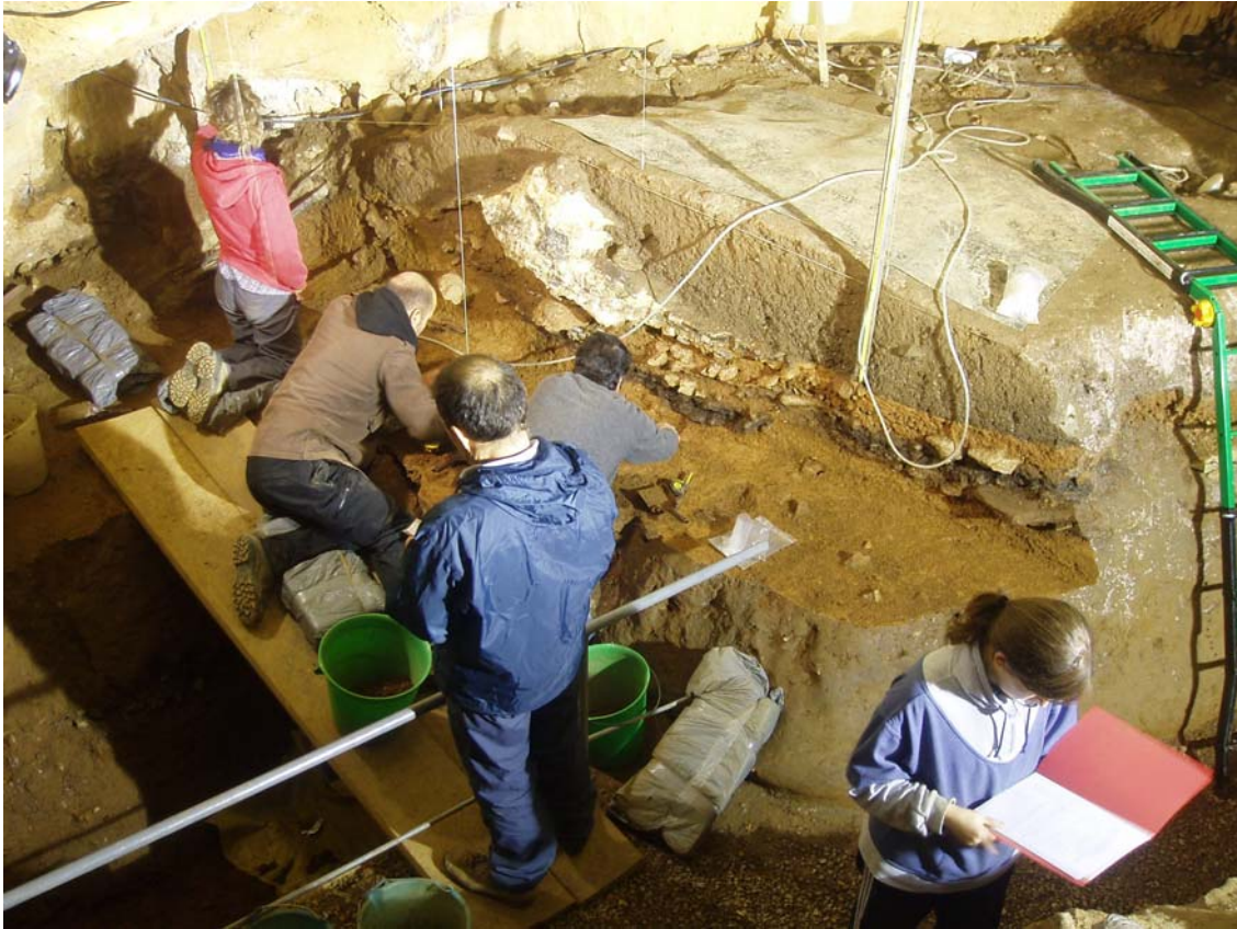
Figura 6. Excavaciones recientes en Santimamiñe.

Especialmente destacable es el hallazgo, entre el material de los niveles neolíticos, de las primeras conchas utilizadas como herramientas de la prehistoria cantábrica (Gutiérrez Zugasti et al. , en prensa b). También recientemente, las intervenciones realizadas en Linatzeta (Tapia et al. , 2008) han puesto de manifiesto la existencia de moluscos en el yacimiento, que han sido analizados por Álvarez Fernández (marinos) y Gutiérrez Zugasti (terrestres).