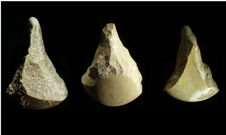
Figura 1. Picos asturienses procedentes de Mazaculos II.

A principios del siglo XX, a los eruditos locales, como el Padre Sierra o Alcalde del Río, se van a unir una serie de investigadores procedentes de otros países, y juntos van a dinamizar la investigación arqueológica en la región. Comienza así una larga tradición de investigadores extranjeros trabajando en el Cantábrico, dominada en estos primeros momentos por la escuela francesa (Straus y Clark, 1978:292), a través del Instituto de Paleontología Humana de París, creado por el Príncipe Alberto I de Mónaco. Entre estos investigadores extranjeros destacan las figuras de Breuil, Harlé y Obermaier.