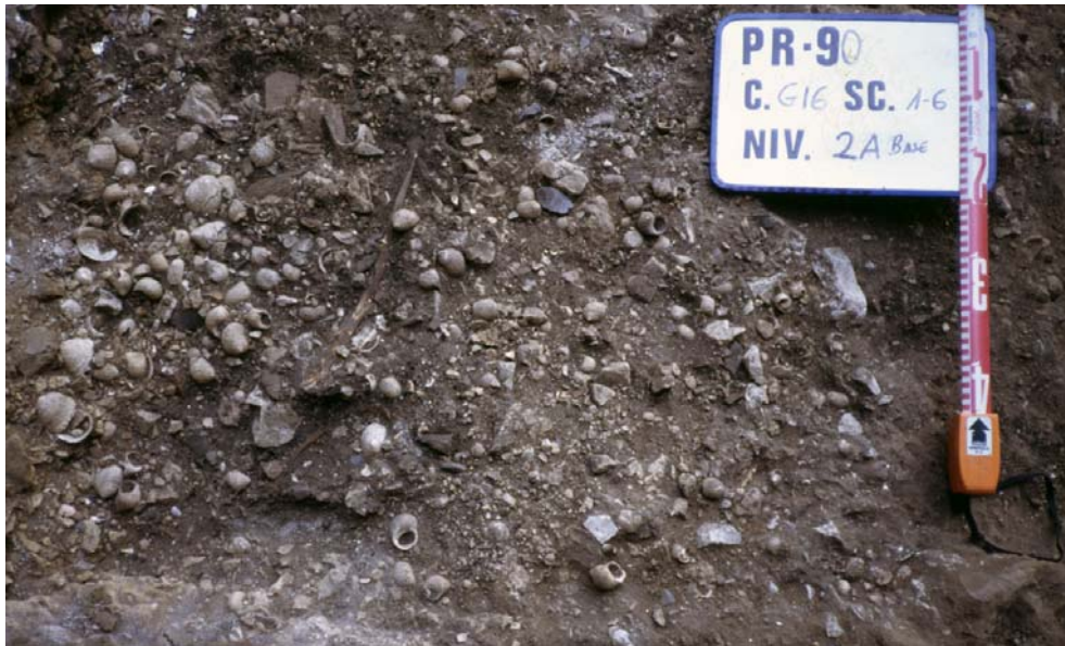
Figura 5. El conchero aziliense del Abrigo de la Peña del Perro en proceso de excavación durante la campaña de 1990.