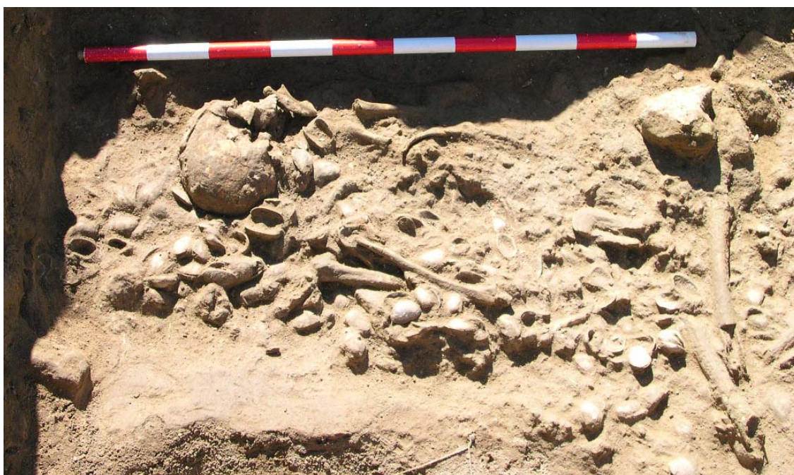
Figura 2. Vista del enterramiento cubierto por los moluscos

En uno de los silos se documentó un enterramiento, el cual poseía la particularidad de estar cubierto con un total de 477 ejemplares de la especie Tapes decussatus , algunas de ellas con las valvas aún articuladas (Figura 2).