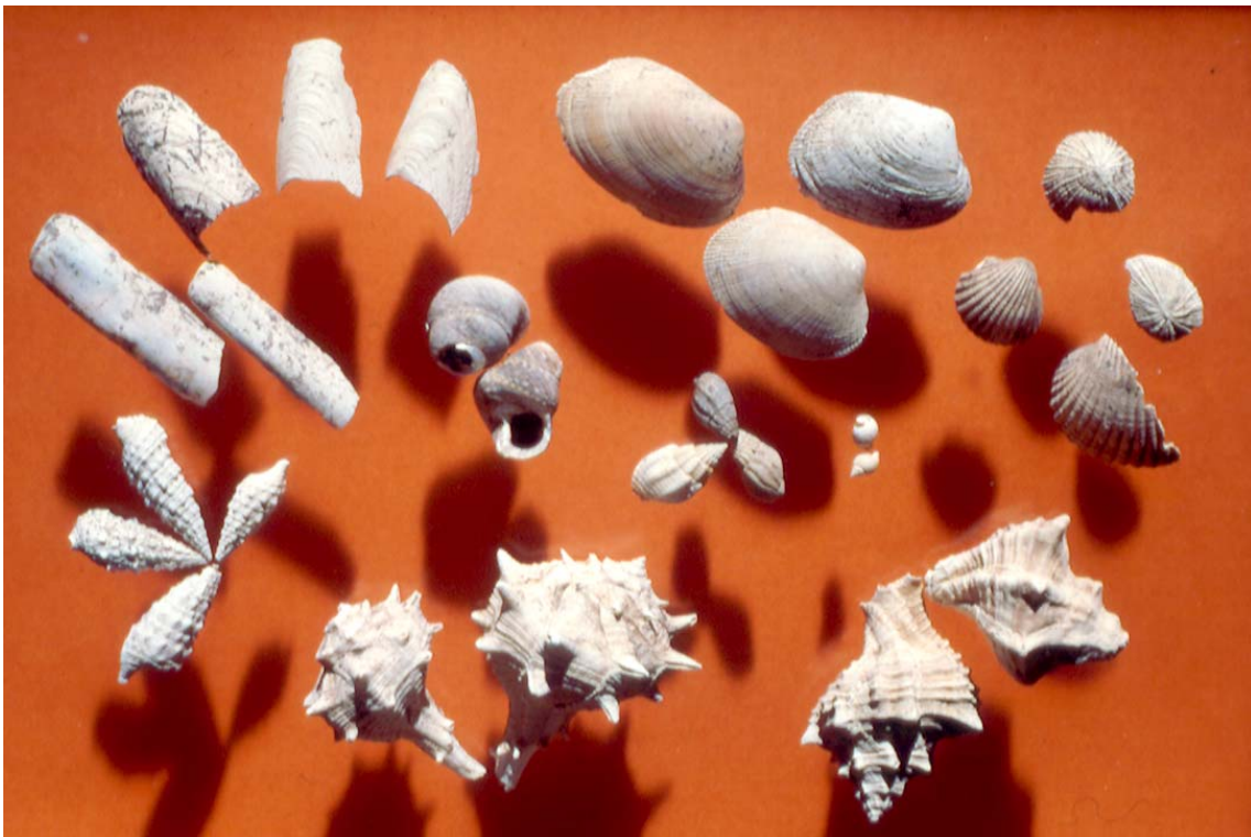
Figura 1. Conjunto taxonómico de la malacofauna de El Retamar

La distribución de hallazgos malacológicos en el asentamiento señala un mayor porcentaje en el Corte 1, debido al elevado número de estructuras (7 hogares y 54 concheros) (Ramos y Lazarich, 2002a, 2002b).