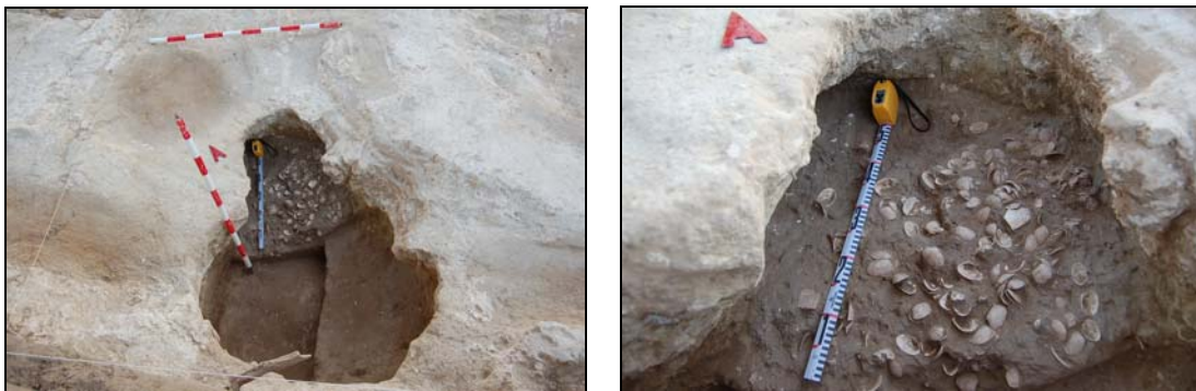
Figura 3. Dos vistas de uno de los concheros de Valdespino

En cuanto a la única especie de gasterópodo marino registrado, Monodonta lineata , cuenta con tan solo 1 NMI, que supone el 0'69% del índice de dominancia y el 0'613 del índice de constancia.