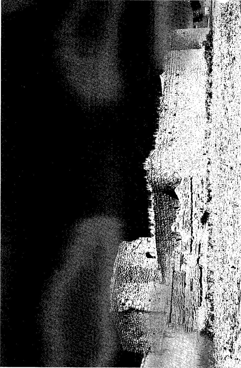
Lámina 2.- Fuente el Sol desde el noroeste, en 1989.