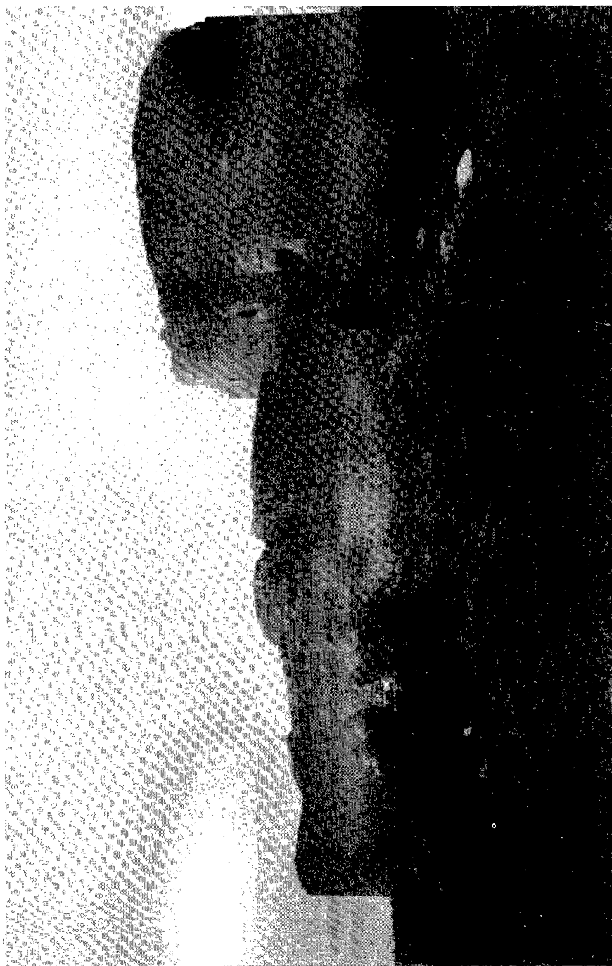
Lámina 1.- El castillo de Fuente el Sol, a mediados de los años sesenta.