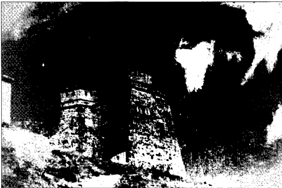
1- Frente anterior y posterior del desaparecido fortín de Torre Blanca (mediados del siglo XVIII), en el término municipal de Fuengirola. Fue desmantelado en los años 60 para levantar la urbanización que hoy lleva su nombre (las fotografías fueron tomadas por J. Tembory unos años antes de su demolición (Biblioteca Provincial de Málaga. Sala Tembory. Archivo fotográfico).