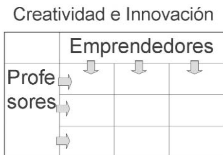
Fig. 2 Un enfoque multidisciplinar

Generando ideas: las convocatorias Humanidades-Empresa.