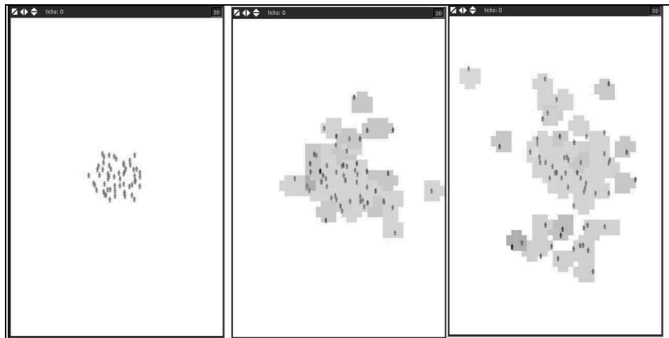
Figura 3. Tres estados sucesivos de una misma simulación: i) a la izquierda: estado inicial, 57 familias todas ellas con el mismo “consenso cultural”, ii) en el centro: después de 36 ciclos: aumenta la etnogénesis, algunos grupos se fisioan, y emergen diferencias “culturales”, iii) a la derecha: después de 116 ciclos. La etnogénesis continúa. La fisión de grupos se hace más frecuente y las diferencias “culturales” se hacen más profundas.