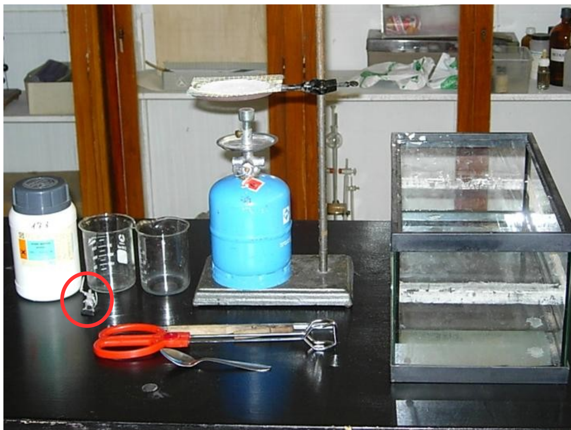
Figura 1.- Dispositivo experimental para el desarrollo de la experiencia.

A continuación, añadimos una cucharada y media de ácido bórico en el vaso y se comprueba que, tras remover, no todo el bórico se disuelve (se lleva en ese momento tres cucharadas de bórico). Es un buen momento para comentar que ya no tenemos una disolución, y que hemos sobrepasado el límite de solubilidad del ácido bórico a la temperatura a la que se encuentra. También puede ser oportuno incidir en la relación intrínseca entre solubilidad, temperatura del disolvente líquido y cantidad de soluto sólido.