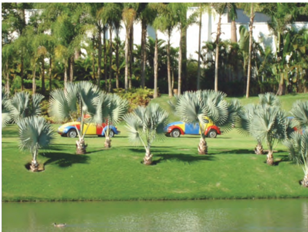
FIGURA 2. Inhotim