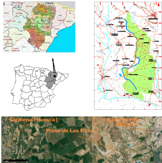
Figura 1.- Localización

con dirección NE-SO. El vaso del embalse se prolonga hacia el Noroeste, a lo largo del Valle de Las Fitas, así como por vaguadas adyacentes.