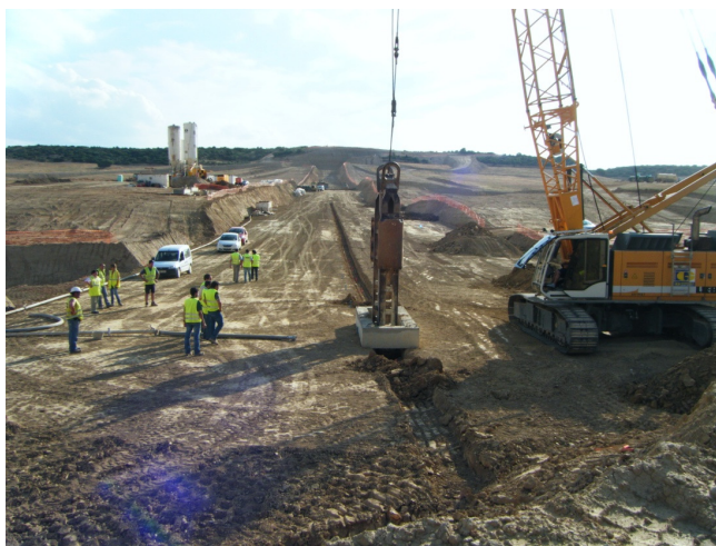
Figura 5.- Excavación de Pantalla Mediante Cuchara Bivalva y Guía Prefabricada de Hormigón

Con la ejecución de los bataches primarios y secundarios alternos se garantiza la continuidad de la pantalla. Pero para asegurar la verticalidad de la misma se empleó en primer momento unas guías de hormigón que posteriormente fueron sustituidas por una prezanja de 0,5 m. aprox. que dirigía la cuchara bivalva y aseguraba la verticalidad del batache. Este proceso queda recogido en la Figura 5