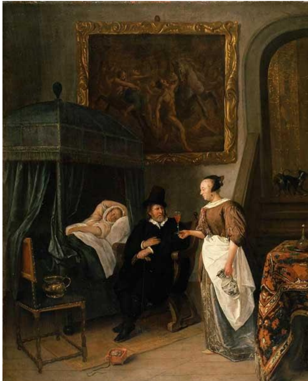
Jan Havicksz Steen (1626-1679). "La visita del doctor" (c.1660-1662). Mauritius. La Haya