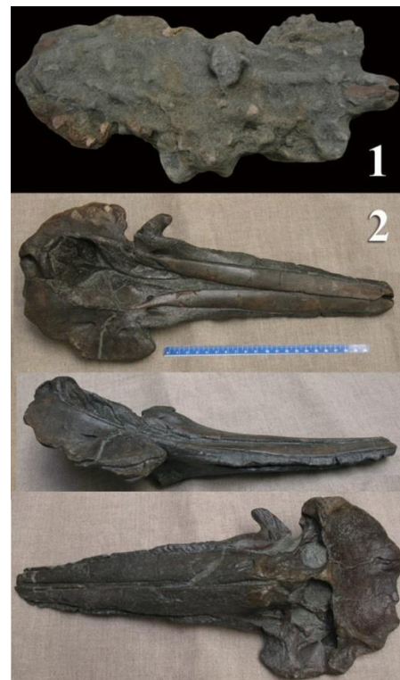
Figura 3. Cabeza de Delfín fósil, arriba, antes de la restauración, y abajo distintas vista una vez restaurado

Los restos fósiles pertenecen en su gran mayoría a vertebrados marinos, sobre todo cetáceos (ballenas), vértebras, costillas, mandíbulas, etc.; también están presentes sirénidos (manatí), y varios mamíferos, como muestran los tres cráneos de delfín, además de vértebras y otros restos, posiblemente incluso de foca. Pero son, sin duda, los dientes de tiburón los hallazgos más frecuentes, desde minúsculas mandíbulas a otras más grandes, pertenecientes al Charcharodon megalodon . También son frecuentes los hallazgos de vértebras de peces pequeños, como sargos, de 'aguijones' de rayas, o de caparzones de tortuga, excepcionalmente conservados. Los estudia María del Carmen Lozano Francisco, del Grupo de Investigación Andaluz RNM353. Son muy abundantes los fósiles de corales y de algas, así como de una gran variedad de moluscos y crustáceos, objeto de estudio de José Luis Vera Peláez, Director e investigador del Museo Municipal Paleontológico de Estepona (Málaga). Hay hallazgos singulares, como los restos de un ave ( Alca ), identificado por Antonio Sánchez Marco, investigador del Instituto Paleontológico de Cataluña.