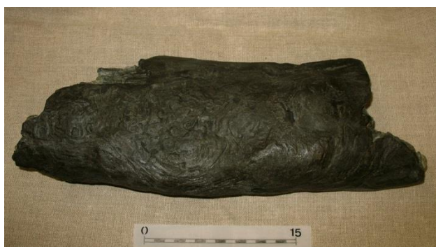
Figura 5. Gran fragmento de madera fósil

Por otra parte, los análisis que se han realizado a los sedimentos han puesto al descubierto una abundante presencia de vida