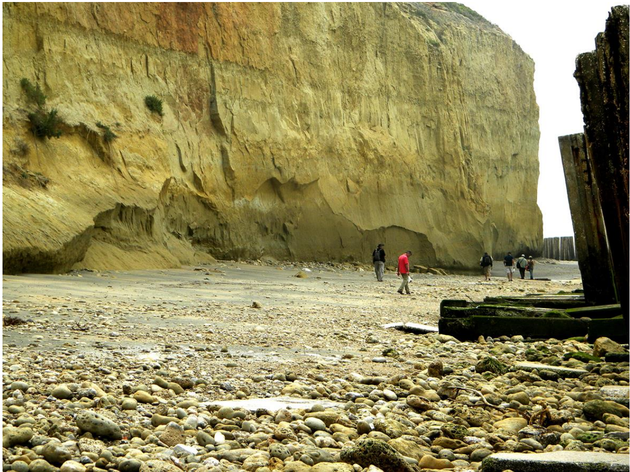
Figura 1. Acantilados en la playa del Almirante, Bahía de Cádiz, en el interior de la base naval de Rota. Se observan su altura, y los diferentes estratos, los fósiles se encuentran en los que están más a nivel del mar

oleaje va desgranando el sustrato, que está compuesto por dos tipos de sedimentos, aunque formados en el mismo depósito; uno blando, donde la conservación de los fósiles es extraordinaria; y otro duro, donde los fósiles se conservan también en buen estado, a pesar de la dureza del sedimento que los cubre. En un tiempo extraordinariamente breve los restos fósiles son esparcidos por la playa, quedando en poco tiempo solo los elementos más duros, como los dientes de tiburón; los restos óseos no cubiertos de sedimento duro son totalmente fracturados y posteriormente disgregados, desapareciendo.