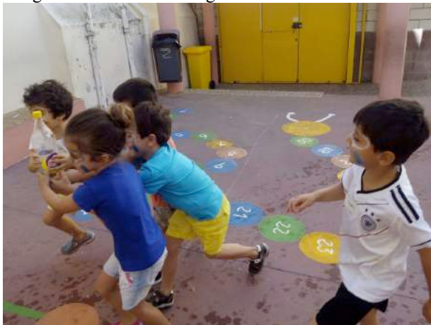
Imagen 4: Taller sobre el agua como bien escaso

Otra de la estrategia que resultó muy útil fue vincular el taller a un juego; este fue el caso del taller sobre el agua como bien escaso (imagen 4). Estos utilizaron el juego como medio de aprendizaje consiguiendo así conectar con los niños.