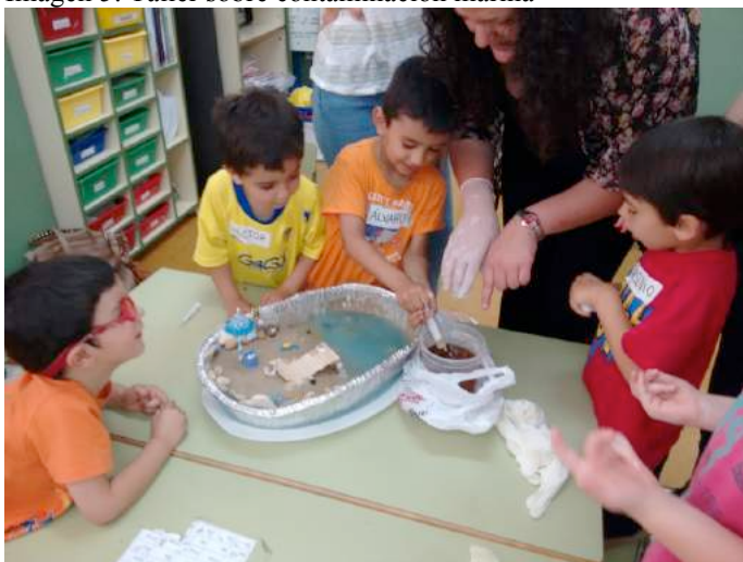
Imagen 5: Taller sobre contaminación marina

Finalmente otros talleres centrados en las explicaciones de los estudiantes con poca interacción por parte de los niños, o aquellos que se basaron más en la observación, resultaron ser menos atractivos que otros que combinaban la observación y la manipulación con el hecho de potenciar respuestas de los niños a través de preguntas motivadoras. Este es el caso del taller sobre la contaminación marina, en él se recreó, a través de una maqueta, una “playa contaminada por aceite”. Los niños establecieron relaciones sencillas de causa y efecto: “Si la playa está manchada de aceite no me podré bañar en la playa”. Se trabajaron los peligros de este tipo de contaminación con el disfrute de la playa, para “solucionar” dicho problema se utilizaba una jeringa (imagen 5).