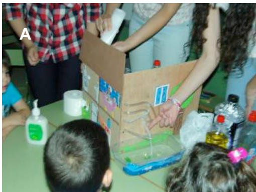
Imagen 3: A) Taller sobre la contaminación del agua (residuos líquidos); B) Taller de hormigas

Por otro lado, la experiencia educativa realizada en el centro, nos dio mucha información de qué estrategias empleadas por los estudiantes conseguían conectar mejor el problema ambiental seleccionado con los niños de infantil. Así, se observó una mayor implicación e interés de los niños en aquellos talleres que se potenciaba una participación más activa, por ejemplo a través de preguntas-problemas planteadas por los estudiantes, que conseguían fomentar la curiosidad de los niños y niñas. Es el caso del taller sobre la contaminación del agua, concretamente, sobre los residuos líquidos generados en nuestra casa (imagen 3A). Los estudiantes recrearon una maqueta de una casa, en la que se podía visualizar las consecuencias de tirar papel al inodoro o el uso de detergentes y jabón. Potenciar lo visual, lo perceptivo, es otra clave a la hora de diseñar un taller sobre temas ambientales. En el caso del taller dedicado a las hormigas (imagen 3B), resultó ser muy atractivo; los niños pudieron visualizar tanto a tamaño natural como ampliado, a través de la P.D.I una colmena de hormigas; identificar tipos de hormigas, distinguir partes de las hormigas y sus funciones; establecer relaciones entre las hormigas, discutir sobre los beneficios de estas en el huerto, etc., son algunas de las cuestiones que pudieron ser trabajados a través de un taller que resultó ser todo un éxito.