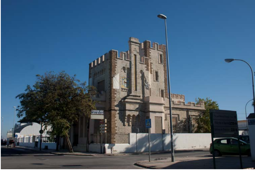
Fig. 3. Vista de un chalet de la Av. Bajo de Guía de Sanlúcar de Barrameda. La ciudad turística.