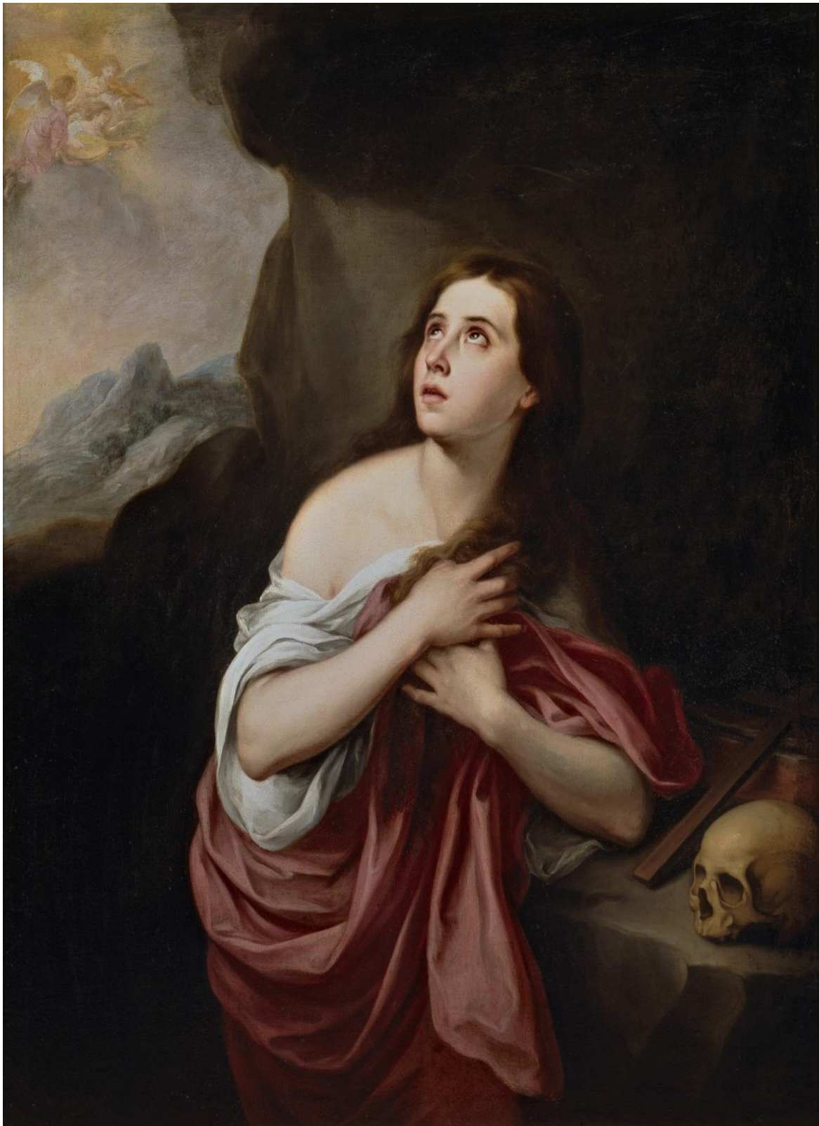
Imagen IV: Magdalena penitente , Murillo, Bartolomé Esteban.