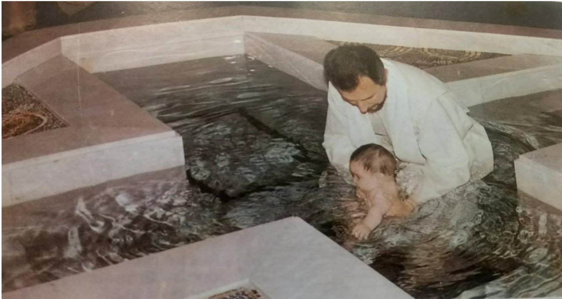
Imagen VII: Bautizo en la piscina.

Fuente: HIGUERAS, Jesús: La Parroquia y el Camino Neocatecumenal: una experiencia , Madrid, Edibesa, 1992.