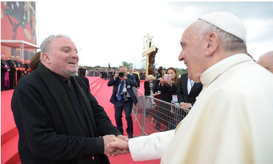
Imagen VI: Papa a Neocatecumenales en su 50 aniversario: «Id en busca de quien aún no conoce la alegría del amor de Dios».