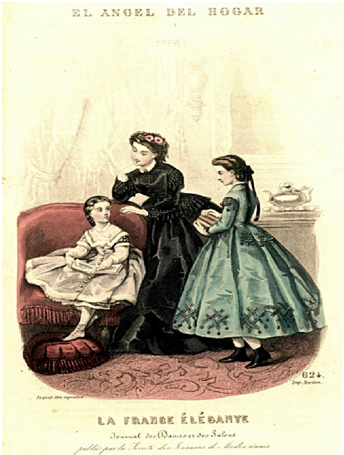
Imagen I: El ángel del Hogar , 24 de febrero de 1865 (nº 7). Mantiene las leyendas originales en francés.