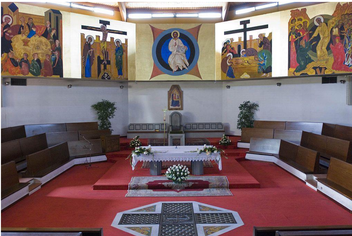
Imagen VIII: Distribución templo.