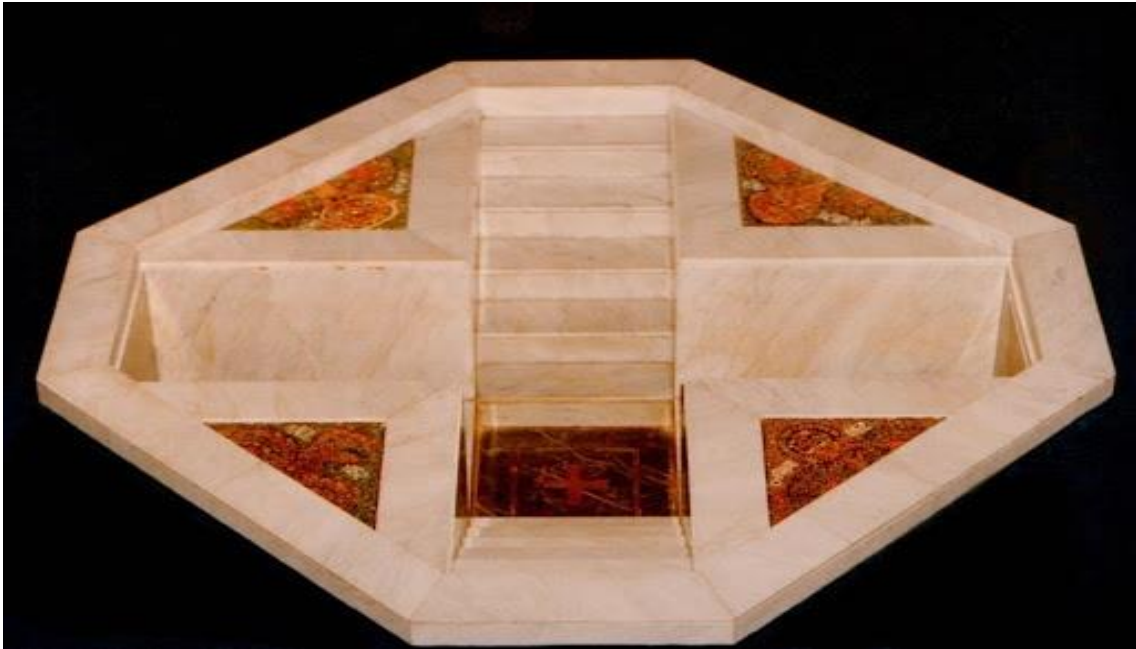
Imagen V: Piscina bautismal.