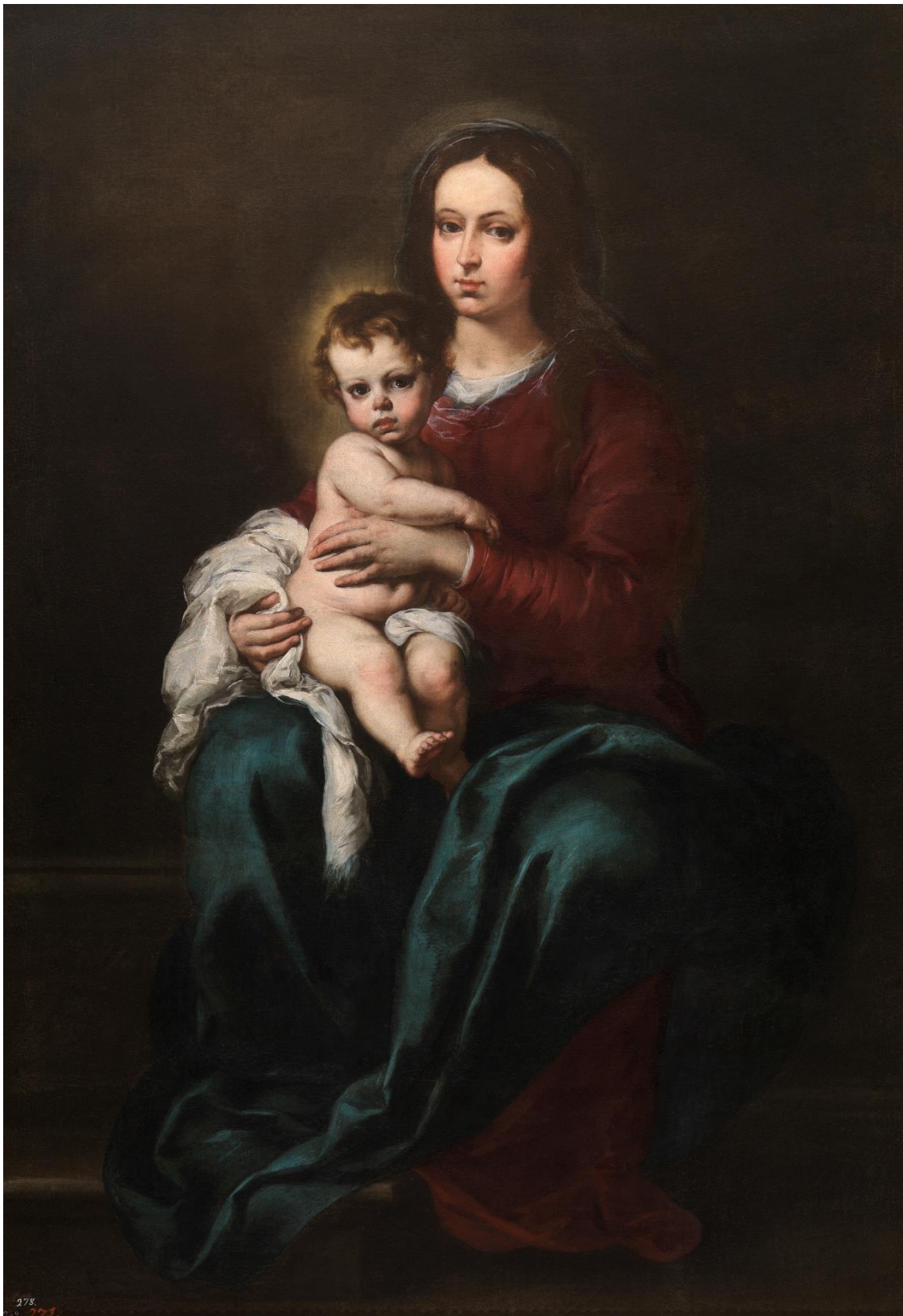
Imagen III: La Virgen con el Niño , Murillo, Bartolomé Esteban.