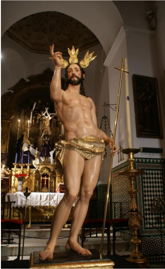
Fotografía nº9: Imagen de Cristo Resucitado, obra de Jerónimo Hernández. Imagen extraída de www.laquintaangustia.org (referencia de la pág. 54)