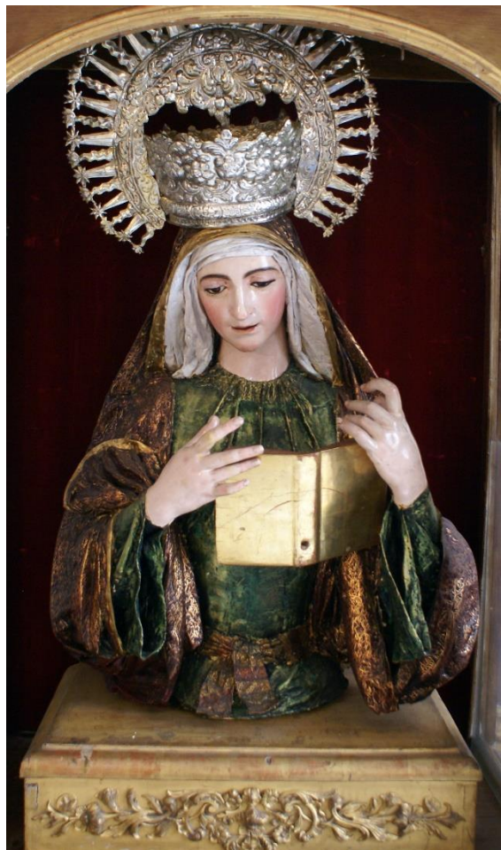
Fotografía nº10: Imagen que se cree que es la de la Virgen de la Encarnación de Martínez Montañés. (referencia de la pág. 58)