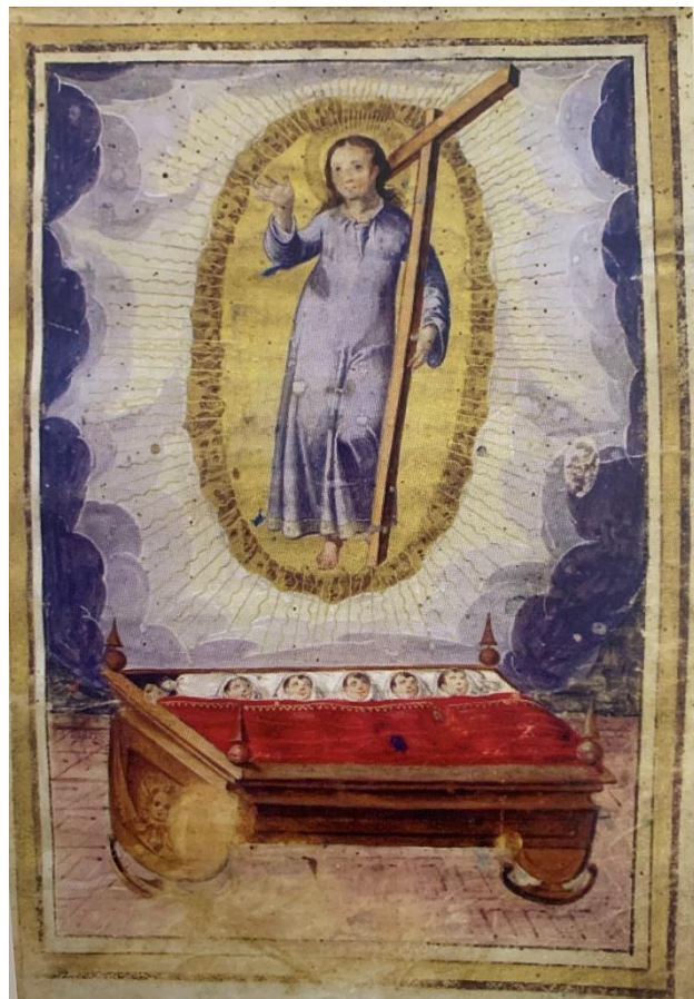
Fotografía nº2: Vitela del Niño Jesús como patrón de los Niños Expósitos. Imagen cedida por Francisco Javier Soto (referencia de la pág. 26)