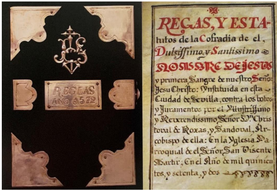
Fotografía nº1: Cubiertas y Portada de las Reglas fundacionales de 1572. (referencia de la pág. 26)