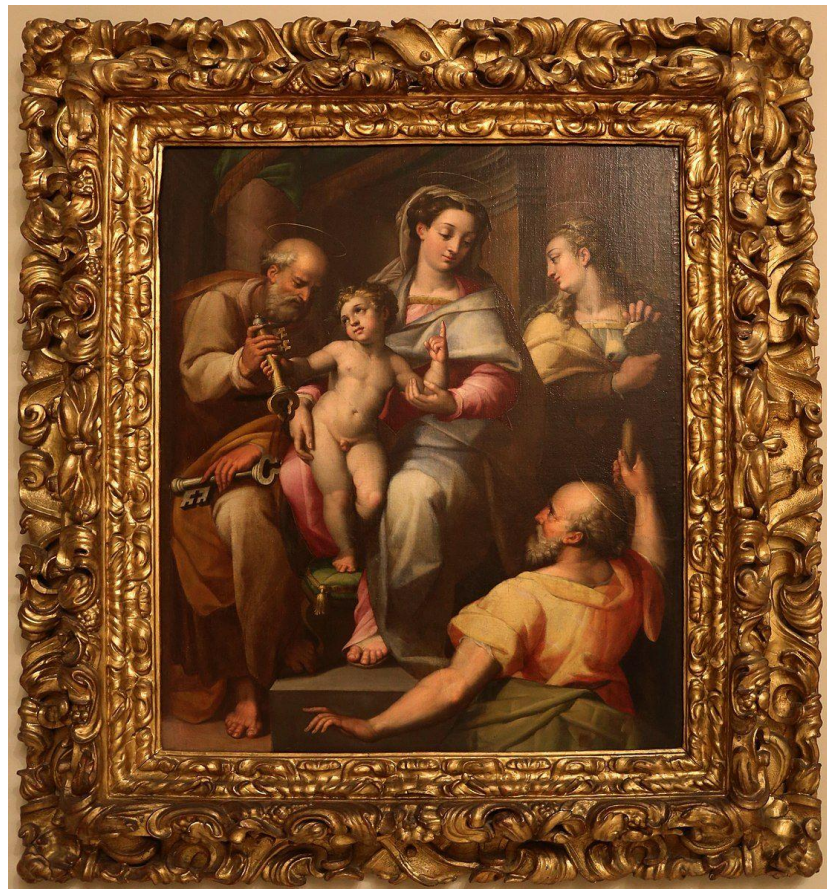
Fotografía nº8: La obra Sagrada Familia con San Pedro y Santa María Magdalena de Orazio Samacchini. Imagen extraída de www.wikipedia.com (referencia de la pág. 53)