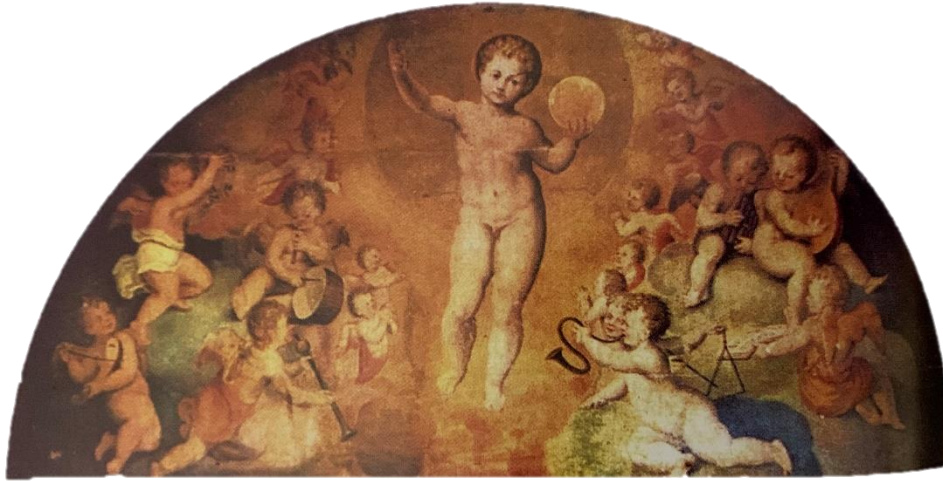
Fotografía nº7: Pintura del ático del retablo de la Visitación de la Catedral de Sevilla, obra de Pedro de Villegas. Imagen extraída de www.wikipedia.com (referencia de la pág. 53)