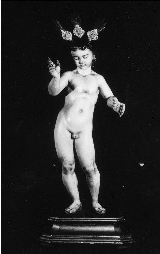
Fotografía n°5: Imagen del Dulce Nombre de Jesús, obra atribuida a Jerónimo Hernández. Imagen propia (referencia de la pág. 51)