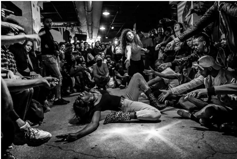
Ilustración 1 "Paris is voguing" de la fotógrafa Teresa Suárez. Cortesía de la autora.

“Para vivir bien hay que esconderse” (Facultat de Filologia i Comunicació UV, 2019: en línea). Sin embargo, esta expresión no ayuda a todo el mundo. Como se ha mencionado, hay quiénes que no pueden ocultar su manera de hablar, de gesticular y de expresarse. Las ballrooms dan una respuesta a aquellos que son menospreciados porque tienen la oportunidad de encontrarse con gente que se encuentra en su misma situación. En otros casos, esta micro sociedad contribuirá a que se den cuenta de que no sólo son personas afeminadas, sino que son mujeres transexuales. Lasseindra añade que este proceso se denomina “Feminómène” (unión de las palabras Feminine (Feminino) y Phemonème (Fenómeno) en francés).