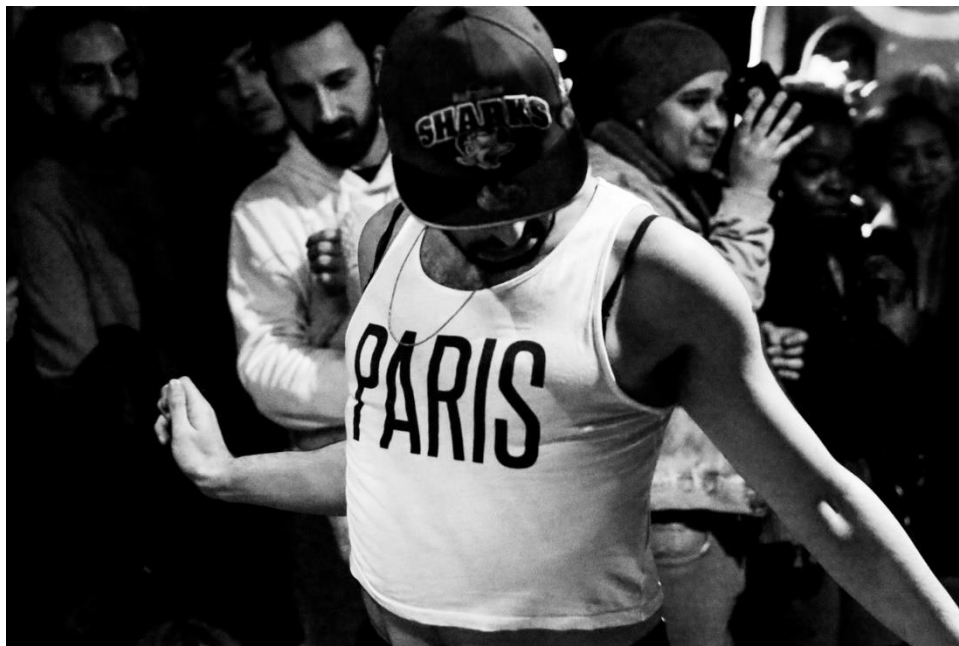
Ilustración 2 "Paris is voguing" de la fotógrafa Teresa Suárez. Cortesía de la autora.

movimiento que nace para la lucha y contra la injusticia causada por las discriminaciones hacia negros, homosexuales, transexuales... Introducirse en el panorama de la ballroom no es simplemente asistir y coger lo que pueda parecer artísticamente estético y desaparecer, hay que ser partícipe de esta batalla por los derechos. “Pertener a la ballroom es lucha, belleza, arte, política, expresividad y, sobre todo, libertad” (Lasseindra en Facultat de Filologia Traducció i Comunicació UV, 2018: en línea).