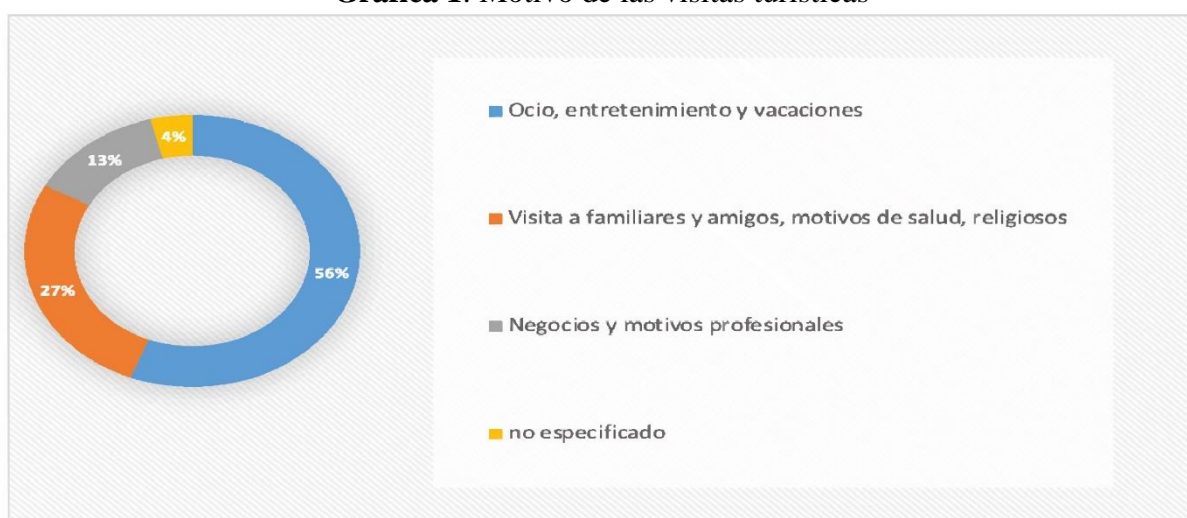
Grafica 1: Motivo de las visitas turísticas