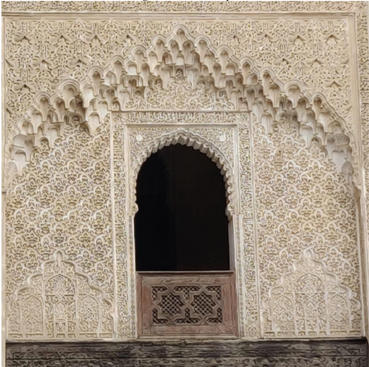
Imagen 2: mocárabe con yeso