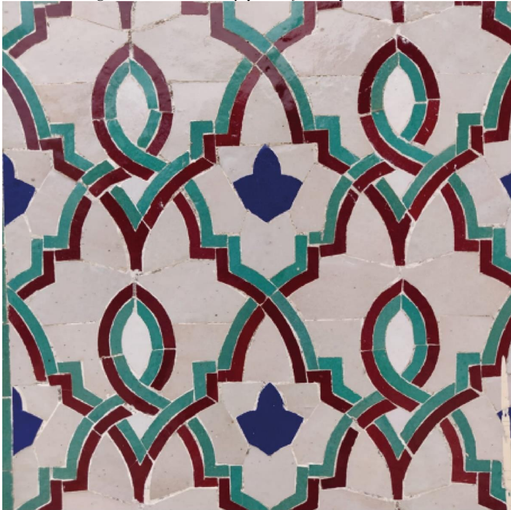
Imagen 3: Técnica “ al-drīy y al-ktef ” trabajada en cerámica