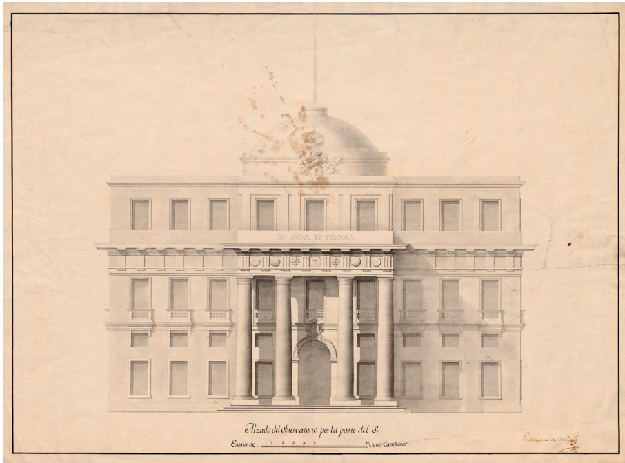
Plano del proyecto para el alzado frontal para el Real Observatorio de la Armada de San Fernando. Marqués de Ureña. 1791. Archivo del Museo Naval. Madrid

un imaginario Regimiento de la Posma ideado por su gran amigo el marqués de Méritos y al parecer en elogio al conde de O'Reilly).