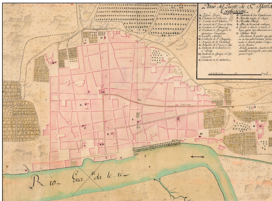
Plano de El Puerto de Santa María. Escala gráfica de 200 toesas [= 10,9 cm]. Anónimo, c.1730. Centro Geográfico del Ejército. Arm. G TBLA. 9ª Carpa. 4ª núm. 937

de oro y diamantes y un anillo de brillantes (Martínez 2017: 110). En la boda se intercambiaron anillos y en sus testamentos establecieron que el anillo del que falleciera debía venderse y dedicar lo obtenido a caridad.