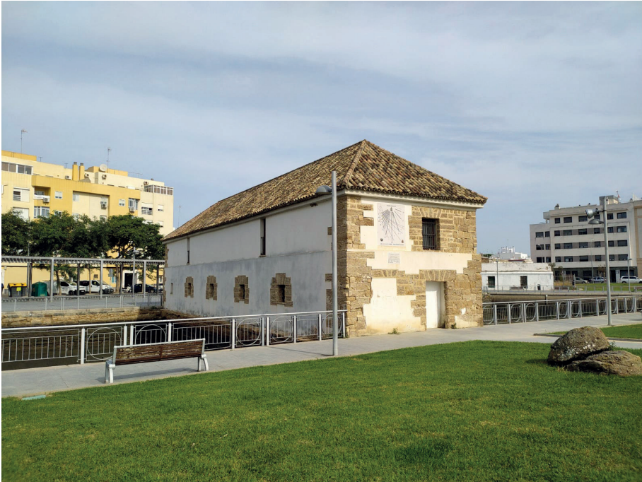
Molino del Zaporito. San Fernando