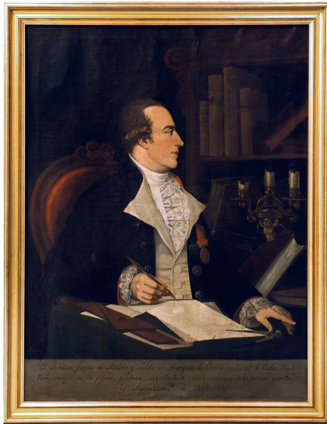
Retrato del marqués de Ureña. Aguado. 1885. Museo de las Cortes. Cádiz

aparece de perfil, y un retrato al óleo que se conserva en el Museo de las Cortes de Cádiz, realizado por Aguado en 1885 a los sesenta y nueve años de su muerte, de escasa calidad y que parece realizado a partir del mencionado grabado. En él aparece en su despacho, escribiendo con su pluma, ante un velón y una estantería con libros. Viste casaca con bordados y luce la cruz de Santiago. Pemán (Ureña 1787-1788/1992: 62) refería en su obra que hacía poco moría el último de sus descendientes directos sin sucesión, y que, al tener una situación económica no desahogada, había vendido las últimas reliquias y restos de su biblioteca.