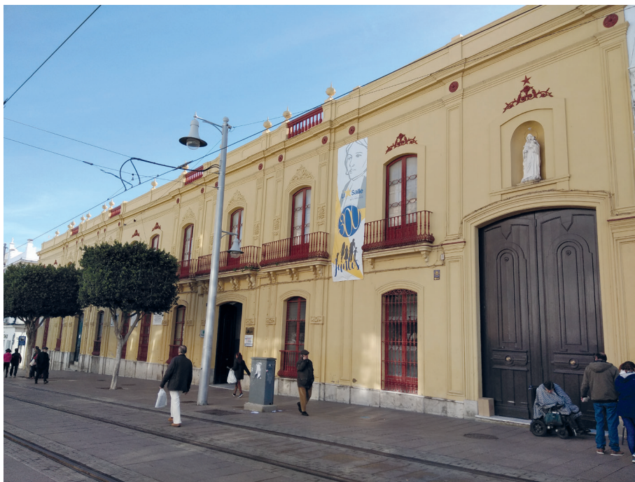
Edificio isabelino que ocupa el solar donde se situaría la casa del marqués de Ureña. San Fernando

hizo que Ureña figurara después entre los deudores de la testamentaría de Martínez a la hora de su muerte 20 .