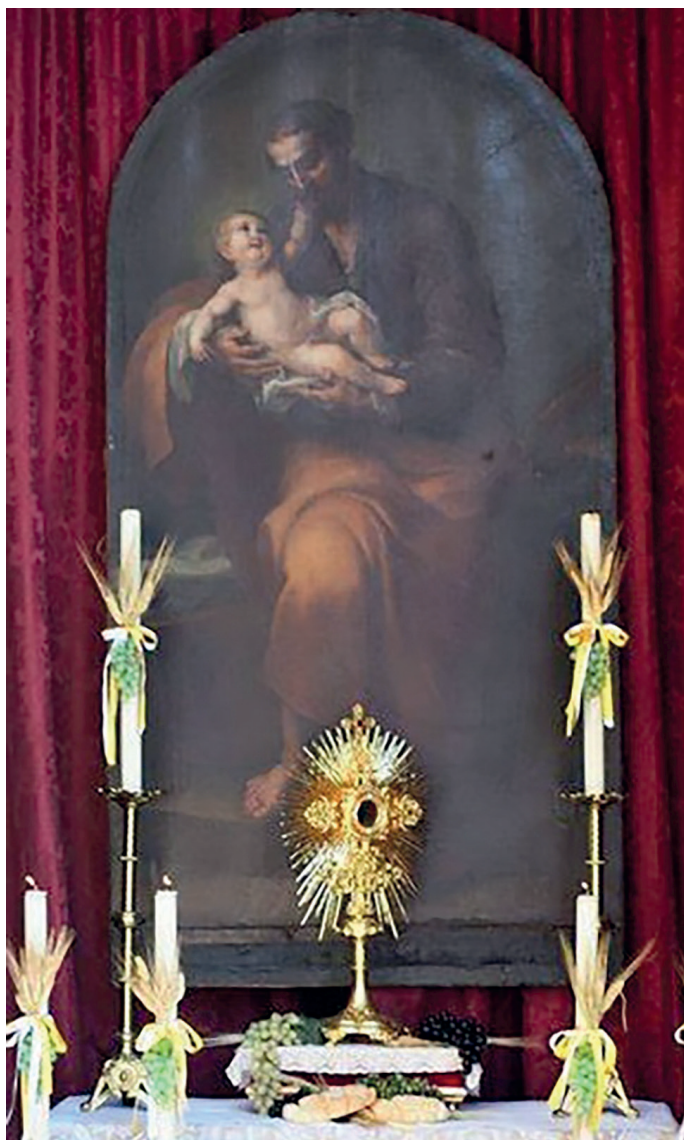
San José y el Niño. Marqués de Ureña. Segunda mitad del siglo XVIII. Seminario de San Bartolomé. Cádiz

reparten entre todas las áreas de las ciencias y las artes. También en este caso, por falta de espacio no podemos tratarlas en profundidad, pero vamos, al menos, a enumerarlas.