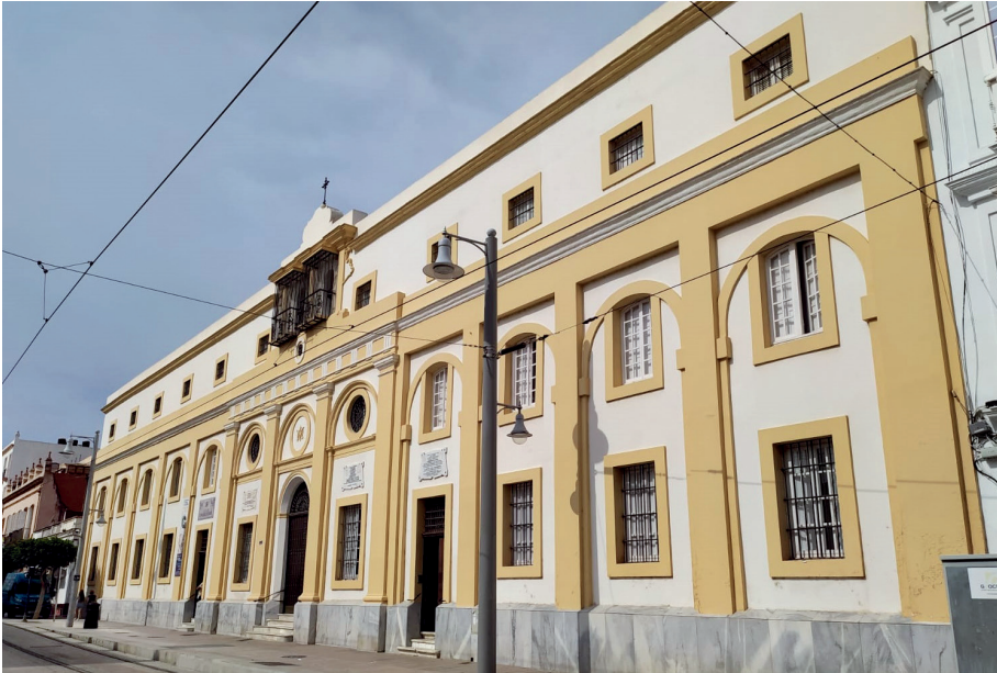
Antiguo convento de La Enseñanza, actual de la Compañía de María. San Fernando