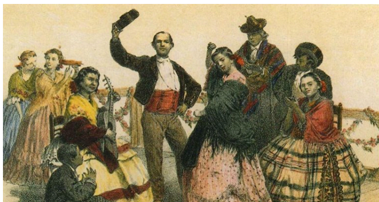
Baile de gitanos ante Isabel II-1861.

Revista La Flamenca. Carmen Heredia (Máster interuniversitario en investigación y análisis del flamenco). 10/2/2021