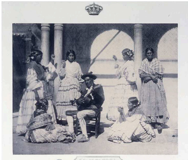
La Alhambra. Gitanos Bailando (1862). Crédito: Clifford, Charles

“El traje de flamenca” (Martínez Moreno, Rosa-María, 2009) aporta una reflexión sobre la utilización de algunos elementos expresivos propios de la cultura andaluza y de su posible manipulación para la difusión de la imagen de Andalucía en el exterior y nos ayuda a reflexionar sobre el hecho evolutivo del traje de flamenca.