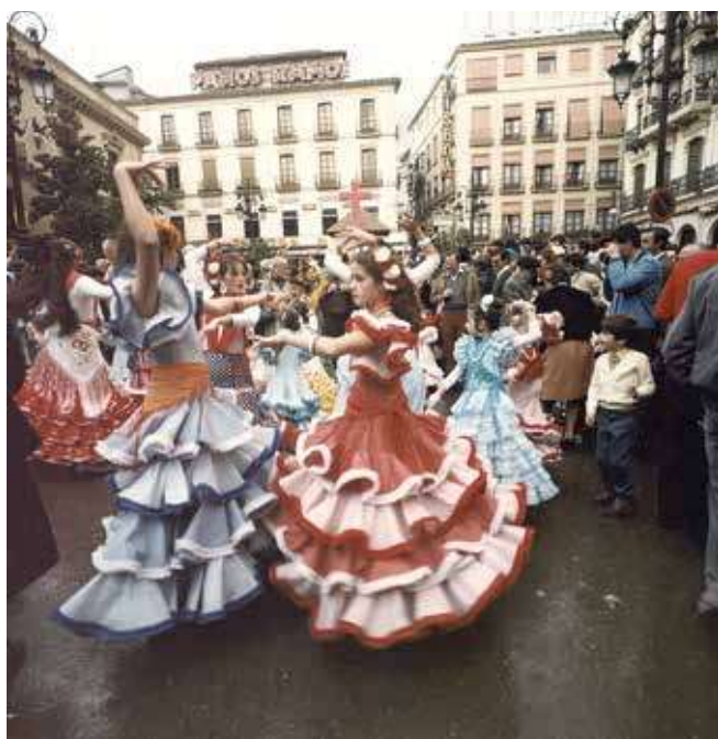
Archivo Municipal de Granada.

ISABEL II Y EL PROTOFLAMENCO. La bailarina internacional que más ayudó al florecimiento del flamenco en los teatros fue Marie Guy-Stéphan. Hasta entonces se habían bailado seguidillas, fandangos, olés y jaleos entre otros. Los aficionados a este arte se denominaban aficionados “al jaleo”. En 1843, la artista hizo posible la creación del primer cuerpo de baile flamenco que recrea el paso el Jaleo de Jerez que hizo en el Teatro del Circo. El baile flamen-