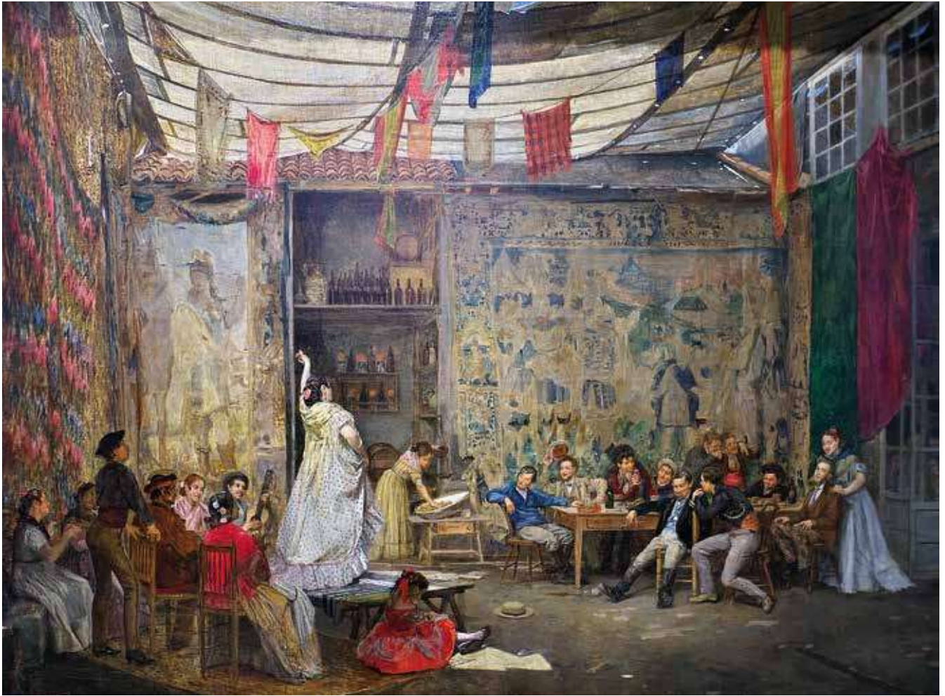
Un día de juerga en Málaga, óleo de B Ferrandiz.