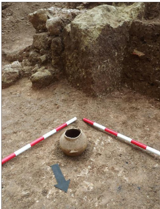
Fig. 4. - Excavación de la urna cineraria donde se halló el semis de Cunbaria (Cortesía de Manuel Rubio Valverde).

esta tumba 7, lo que singularizaría aún más el enterramiento.