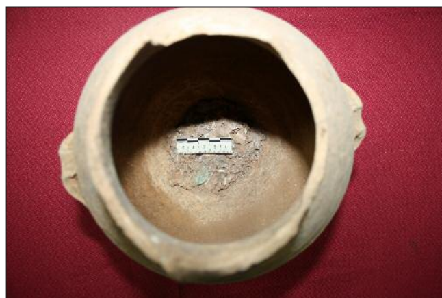
Fig. 7. - Detalle de la ubicación del semis de Cunbaria en el interior de la urna cineraria.

mano derecha y sosteniendo el parazonium en su izquierda, una iconografía que celebra el renacimiento de la urbs tras el incendio de julio del 64 d.C. El infantil aquí enterrado también sufrió la acción del fuego, por lo que la moneda pudo configurar un poderoso talismán que contendría la idea del triunfo sobre la muerte, mientras la imagen de la diosa Roma, renacida tras el incendio, podía ofrecerle protección, fuerza y esperanza en el más allá.