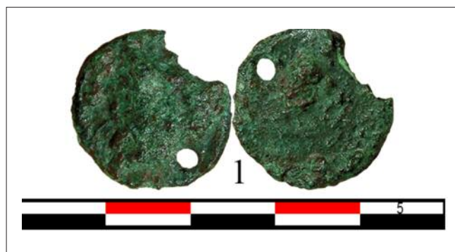
Fig. 6. - Semis perforado de Cunbaria .

En la cremación primaria el sestercio de Nerón formaba parte de un variado ajuar de acompañamiento, objetos que poseen una función simbólica con un significado que resulta difícil desgranar, aunque parece que el fin último sería acompañar al difunto en su nueva vida y facilitarle la participación en los diferentes ritos y ceremonias celebrados en su memoria (Vargas 2001, 158). En cuanto a la moneda, se debe valorar que apenas está desgastada, por lo que es probable que se hubiera seleccionado entre el reciente aprovisionamiento de numerario que había llegado a Colonia Patricia . Así parece indicarlo el hecho de que la cremación se date en época neroniana, a tenor no sólo de la pieza, sino también del resto del material cerámico del ajuar. Pero ¿cuál fue la razón que llevo a elegirla? Creemos que la explicación puede encontrarse en el tipo del reverso: en él figura la diosa Roma sentada, portando una Victoria en su