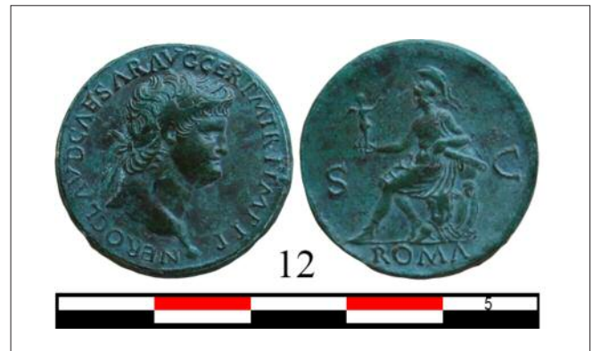
Fig. 1. - Sestercio de Nerón procedente de la incineración 2 de la intervención arqueológica de la avenida del Corregidor durante los años 2003-2004.

Durante la intervención arqueológica realizada en la avenida de los Llanos del Pretorio entre los años 2003 y 2004 se documentó una singular estructura funeraria conformada por cuatro muros en opus quadratum , en cuyo interior se localizaron cinco cremaciones primarias, pudiéndose evidenciar la existencia de, al menos, dos momentos de uso bien diferenciados de la tumba. Tras su cons-