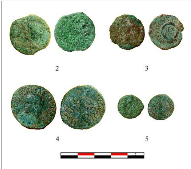
Fig. 8. - Monedas encontradas en diferentes niveles de colmatación: 2. As de Augusto de Colonia Patricia ; 3. As de Augusto de Carthago Nova ; 4. As de Claudio; 5. Cuadrante de Claudio.