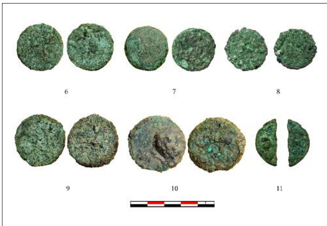
Fig. 9. - Monedas encontradas en diferentes niveles de colmatación: 6-8. Ases julioclaudios indeterminados; 9-10. Sestericios julioclaudios indeterminados; 11. As partido julioclaudio indeterminado.

tancia de su presencia y valorar los tipos de moneda localizados, que completan la visión del numerario de la época, pues esta área del sepulcretum fue cubierta bajo un estrato de limos y no volvió a ser ocupada en época romana, a diferencia de lo que sucede en el área donde se documentó la tumba de Caius Pomponius Staius (Cánovas, Sánchez y Vargas, 2006), en la que desde mediados del siglo I d.C. se combina el uso funerario de la zona con la actividad alfarera; una actividad artesanal que continua a lo largo de los siglos II y III a.C. a tenor de los vertederos de cerámicas documentados.