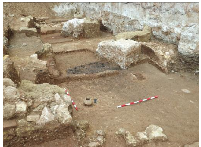
Fig. 3. - Detalle del recinto funerario H.

La única moneda vinculada a un enterramiento es la recogida en el recinto H. Caracterizado por presentar una planta rectangular de 12 por 12 pies romanos y estar delimitado por cuatro cipos de calcarenita – uno de ellos perdido – colocados en posición vertical en cada una de las esquinas ( vid. en este mismo volumen los trabajos de Rubio Valverde y Vaquerizo). En su interior se documentaron tres cremaciones secundarias (T6, T7 y T52), dos de ellas en urnas cerámicas y una en piedra, además de un ustrinum en su parte central (fig. 3). De las tres cremaciones sólo la tumba 7 (fig. 4) presentaba ajuar: un semis perforado de Cunbaria (Las Cabezas de San Juan, Sevilla), datado en el siglo I a.C., que se localizó en la base interior de una urna cerámica de tradición ibérica (fig. 5) del tipo 3 (García Matamala 2002), y acompañaba a los restos óseos de un individuo infantil indeterminado de 0 a 6 años ( vid. en este mismo volumen el trabajo de García-Prósper y Polo-Cerdá, a quienes pertenecen todos los datos sobre la identificación antropológica de los enterramientos).