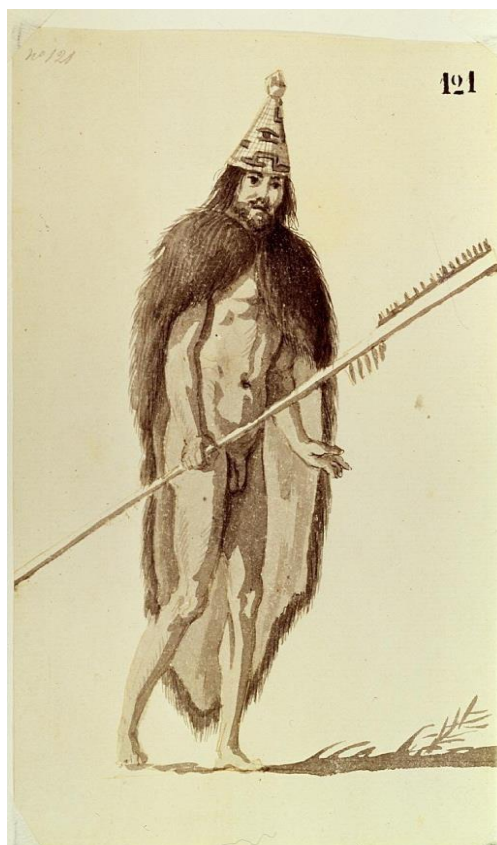
Figura 9. “indio de Nutka” atribuido a Tomás de Suria. Fotografía de Joaquín Otero Úbeda. (Fuente: Museo de América/Red Digital de Colecciones de Museos de España).

No obstante, además de los retratos de los jefes principales del establecimiento, se recogen dibujos en los que se representa a otros indios. La siguiente imagen destaca por su valor etnográfico, ya que en ella se encuentra plasmado un elemento interesante sobre el identitario arte de pesca de estas costas. En este caso, el indio porta un instrumento pesquero especialmente característico de las culturas tradicionales del Noroeste, como era el rastrillo de arenques. Dicho instrumento junto a su método de uso aparece descrito en el diario de Espinosa, uno de los oficiales que viajó junto a Malaspina: