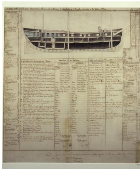
Figura 2. “Pertrechos de las corbetas” atribuido a Felipe Bauzá.

sumo interés encabezado por la representación de la corbeta Descubierta , en el que se recoge una minuciosa descripción del estado individual del apresto, armamento y pertrechos de ambas corbetas, así como de las categorías y oficios de los individuos que formaron parte de la expedición.