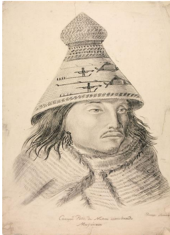
Figura 8. “Cacique principal de Nukta nombrado Maquinna” firmado por Tomás de Suria.