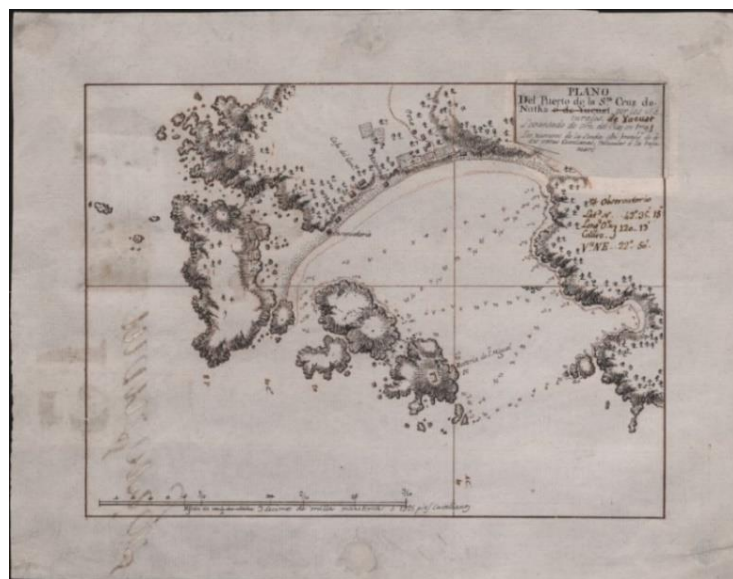
Figura 5. “Plano del Puerto de la Sta. Cruz de Nutka, 1791”. (Fuente: Archivo Histórico de la Armada Juan Sebastián de Elcano/Biblioteca Virtual de Defensa).

El 1 de mayo de 1791, pusieron rumbo al Noroeste, recalando el 27 de junio en Puerto Mulgrave, en la actual bahía de Yakutat, donde permanecerían hasta el 5 de julio. Allí, iniciaron la búsqueda del “paso del Noroeste”, sirviéndose de las cartas marítimas del capitán Cook. Sin embargo, no llegaron a encontrarlo, solo avistaron un pequeño fondeadero al que denominaron “Bahía del Desengaño” 49 . A pesar de que los trabajos de exploración desarrollados en el área resultaron fallidos en lo que respecta al objetivo principal de la misión, los expedicionarios pudieron entrar en contacto con la población indígena del lugar, los llamados tingit yakutat , de los que obtuvieron información de gran valor etnográfico pese al reducido tiempo que permanecieron en dicha estancia. La siguiente parada del recorrido de las corbetas por la Costa Noroeste americana fue el enclave de Nutka, al que arribaron el 13 de agosto tras una larga travesía.