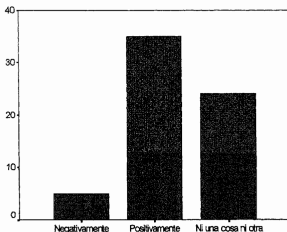
¿Cómo valoras la formación en la práctica que se da en la Facultad en cuanto a actividades de ocio?

En cuanto a la posibilidad o no de colaborar de nuestro alumnado conjuntamente con otros grupos de edad, ya esta constatado, debido a la elección de carrera que han realizado, preferentemente la del trabajos con la infancia, pero también con otros grupos de edad y esto dependiendo de cada especialidad.