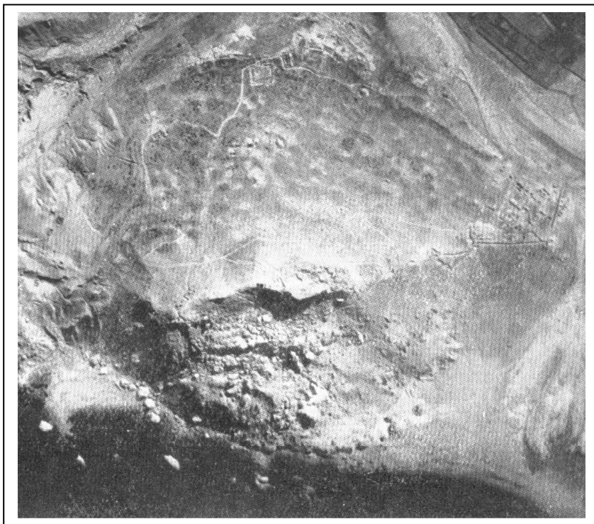
Fotografía aérea de la colina de Cazaza. El puerto se hallaba en la zona inferior izquierda del espectador, con la protección de una torre. Evidencias de una coracha.