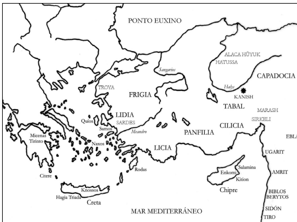
Figura 1. Contexto político y económico del asentamiento asirio de Kanish.

Kanish ( Kanešh ), antigua ciudad de Capadocia situada en la orilla izquierda del río Halis y a los pies de la actual Kültepe, fue uno de los centros comerciales del Antiguo Imperio Asirio en Anatolia que florecieron entre los siglos XX y XVIII A.C. y especialmente durante el reinado de Sargón I. Ciertamente la estrategia comercial asiria venía a sustituir la antigua forma imperialista de apropiación de los recursos ajenos mediante la guerra por otra nueva establecida sobre el principio comercial administrado fundamentado en tratados concluidos con los gobernantes locales sobre la base del interés mutuo, aunque bajo orientaciones similares como eran las de controlar los intercambios de oro y plata por estaño y tejidos, así como el monopolio del comercio del cobre procedente de la región del Caspio.