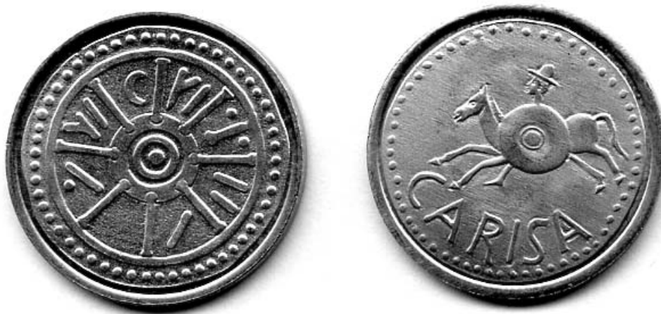
Figura 1. Monedas de Iptuci (a izquierda) y Carissa (a derecha)

salinas costeras y de las marismas, aspecto éste que explicaría, junto a los análisis de paleocosta generados por la geoarqueología, la aparición de los conocidos delfines en el tipo monetar asidonense.