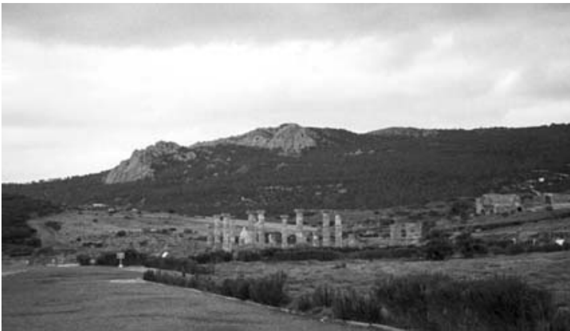
Figura 2. La Silla del Papa, asentamiento original de Bailo . En primer plano, el foro de Baelo Claudia

Además de estos contenedores arcaicos, en un contexto que abarca desde el siglo V a principios del IV AC en el que se constata una franca reducción del número de restos de contenedores, también han podido ser identificadas claramente las ánforas Mañá-Pascual A4 y Tiñosa (Carretero, e.p.). Al respecto de éstas últimas, consideradas como envases dedicados al envasado de aceite, habría que decir que este mismo sitio hasta fechas muy recientes se conservaba un olivar agrícolamente activo. Por otro lado, de confirmarse la extensión propuesta para este asentamiento (unos 14.000 m 2 , según Lavado, 2000: 385), así como la inalterable vitalidad comercial del centro desde el siglo VII, por lo menos, paralela, por otra parte, a la constatación de un aumento de la presión antrópica sobre las posibilidades productivas del suelo agrícola con vistas a la comercialización con los fenicios de Gadir , no nos parece al respecto que tenga mucho sentido hablar de una villa rural (y menos si consideramos como modelo el Cerro Naranja), sino de asentamiento estable de mayor entidad física, política y económica.