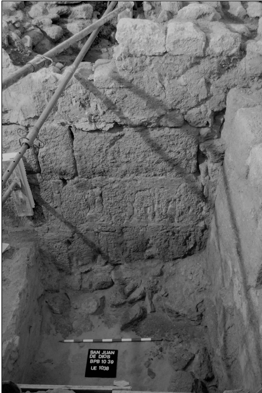
Figura 4. La muralla aparecida en el sondeo arqueológico realizado junto a la calle Posadilla, que muestra claramente la estructura de la misma, de grandes sillares y revoque hidráulico en las juntas. En este lugar se proponía la existencia de una torre. Los resultados arqueológicos indican que ésta se ubicaba, más bien, al interior de la muralla, a modo de torre-puerta.

este tramo de la cerca donde se puede observar la fábrica predominante en el alzado, mampuesto en piedra, y que debe corresponder a las numerosas remodelaciones y reparaciones realizadas en época cristiana, pero sin variar el trazado la misma.