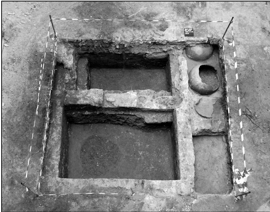
Figura 2. Estructura exhumada en el segundo patio del Hospital de la Misericordia, perteneciente a la Carnicería Mayor. Se trata de una gran pileta colmada con restos provenientes de los trabajos de despiece del ganado.