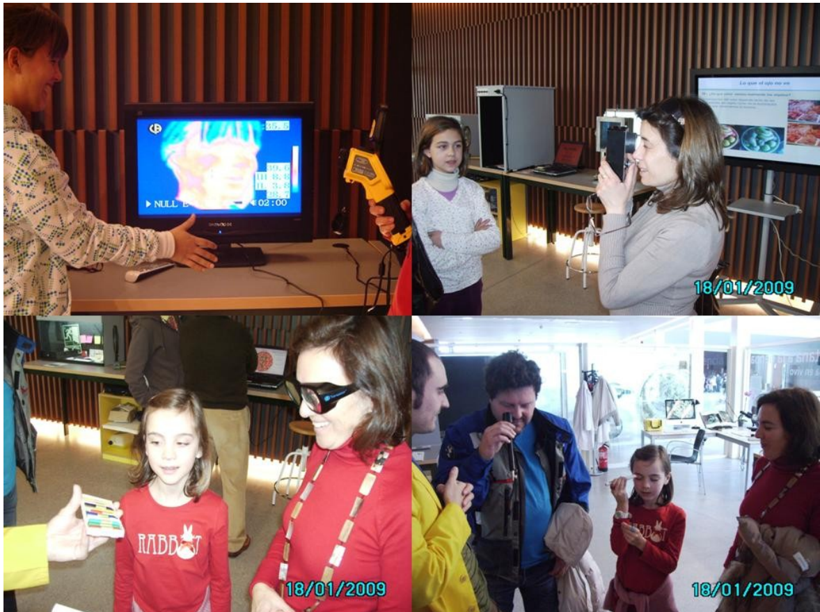
Figura 1.- Visitantes realizando distintas experiencias.