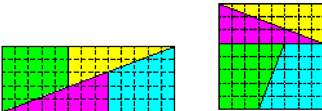
Figura 1.- Prueba geométrica de que "65 = 64" (Alegría, 2006).

Es conocida la falacia geométrica que origina esta propiedad, como mostró Sam Loyd por primera vez en 1858.