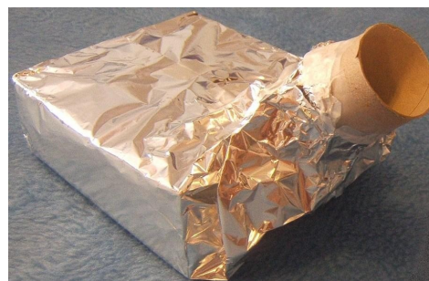
Figura 2. Aspecto del espectroscopio casero.

A continuación se doblan las cartulinas por las líneas punteadas. Las etiquetas numeradas que se muestran en la figura 1 indican la forma en la que debe pegarse la cartulina; por ejemplo, la pestaña con el número 1 indica que debe pegarse tras la zona sombreada etiquetada con el número 1, y así sucesivamente. El número indica el orden sugerido para pegar la cartulina. Se comienza pegando las pestañas 1 y 2 en los lugares indicados. Seguidamente se pega el CD a la cartulina, de forma que quede al aire la cara